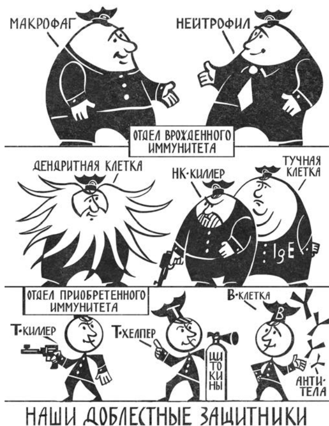
Рис. 1. Главные герои нашей полицейской истории

В первой части книги мы познакомимся с главными героями и антигероями нашего полицейского кино, а во второй рассмотрим, насколько разные сценарии иммунного ответа способны разыгрывать эти персонажи в зависимости от задач, стоящих перед организмом.