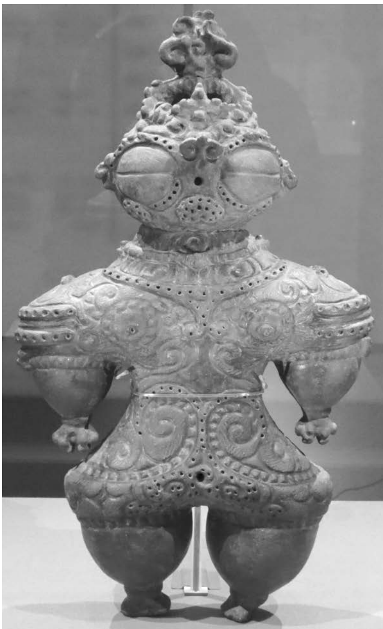
Догу позднего периода Дзёмон, Национальный музей Токио.