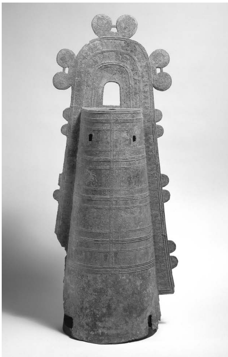
Бронзовый колокол дотаку эпохи Яёй, Метрополитен-музей, Нью-Йорк, фонд Роджера 1918 (18.68).