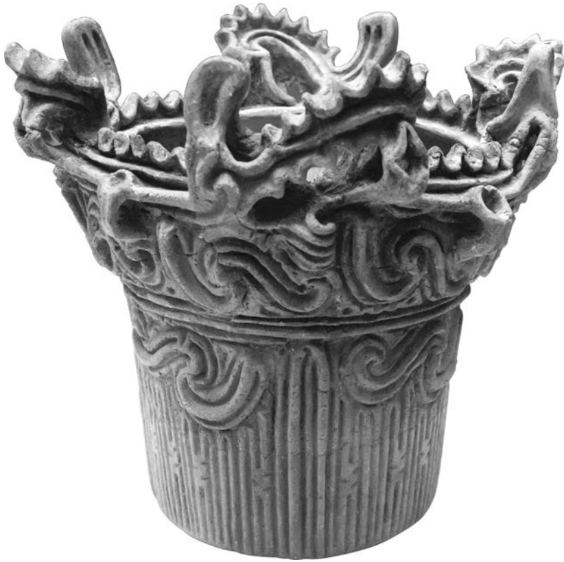
Сосуд среднего периода Дзёмон, Британский музей.