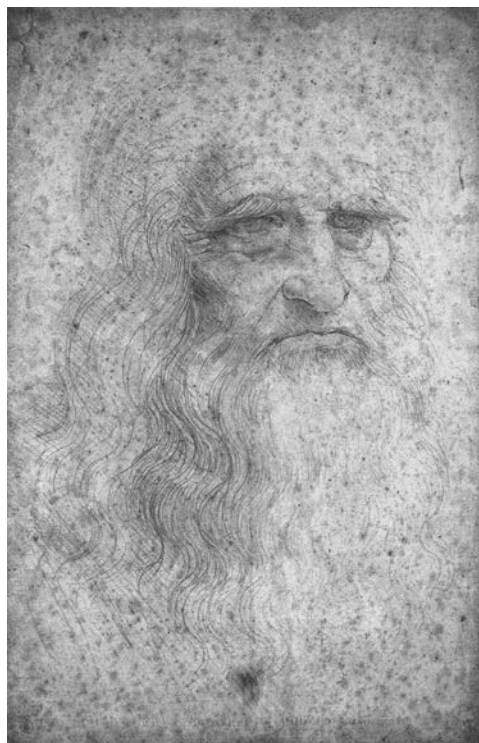
«Туринский портрет». Предполагаемый автопортрет Леонардо да Винчи в возрасте 60 лет

в течение продолжительного времени. Художник Франческо Джост провел в таком режиме 19 суток, адаптировался к нему, сохранив работоспособность, и по окончании эксперимента тут же записался на следующий, который длился 48 суток. Франческо спал по 3 часа в сутки (6 раз по 30 минут), и при этом его работоспособность сохранялась на достаточном уровне. Результаты экспериментов привели в недоумение самого ученого: в то время, когда они проводились (в 1990 г.), был уже накоплен достаточно большой материал о вреде ограничения сна (так называемой депривации сна) для профессиональной деятельности и здоровья. Клаудио Стампи сделал вывод о том, что «режим Леонардо» возможен для некоторых людей, генетически приспособленных