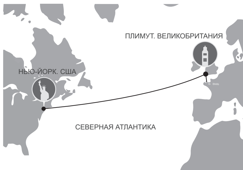
Маршрут регаты OSTAR

время преодоления маршрута от Плимута в Британии до Нью-Йорка в США составило 38 дней, в то время как в 2000 г. на это ушло только девять дней. При анализе результатов гонок обсуждается вопрос о том, что изменения в технологиях изготовления яхт, произошедшие за это время, не могли оказать столь существенного влияния на улучшение показателей. Главным считается мастерство шкиперов, их умение поддерживать высокий уровень внимания и физической активности. При этом преимущество получают те, кто имеет возможность оптимально распределять свое время сна и бодрствования.