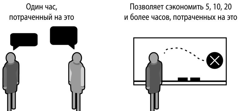
Рис. 1.1. Беседы с потребителями экономят время и деньги

Обнаружив в результате беседы с предполагаемыми потребителями ошибочность ваших представлений, вы предотвратите бессмысленную трату времени на разработку никому не нужного продукта.