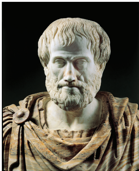
Рис. 1.3 ❖ Аристотель

Первую попытку формализации мышления следует признать за Аристотелем. Конечно, вряд ли древний грек формулировал задачу построения искусственного интеллекта. В античности такая задача не являлась актуальной хотя бы потому, что для древних Земля была населена массой различных мыслящих существ. Современное желание разобраться в вопросе разума, как мне кажется, произошло от осознания уникальности человеческого мышления. И логику силлогизмов, созданную Аристотелем, следует признать попыткой математически точного описания мыслительных процессов. И попыткой, достаточно успешной для того времени.