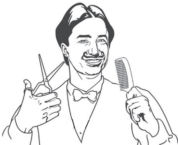
Рис. 1.4 ❖ Деревенский парикмахер

Методы формальной логики ограничены в своем применении даже в очень простых задачах. Для иллюстрации рассмотрим ставшую уже классической проблему парикмахера. Эта задача достаточно сложно излагается в терминах теории множеств, но для ее популяризации придумана очень интересная и простая формулировка. Итак.