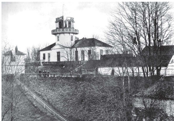
Обсерватория в Дерпте (Тарту)