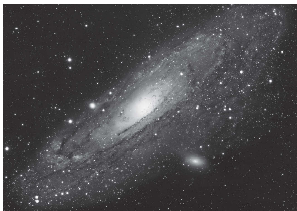
Туманность Андромеды (M31)