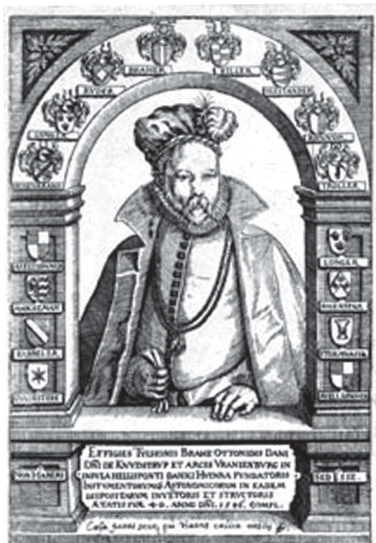
Портрет Тихо Браге на первой странице «Механики»

А потом наступило затишье. Новые звезды перестали вспыхивать. Будто назло. Когда астрономия была в зачаточном состоянии, вспыхивали ярчайшие новые, их видели даже днем, а после изобретения телескопа звезды-гости исчезли. За два с половиной века вспыхнули всего две