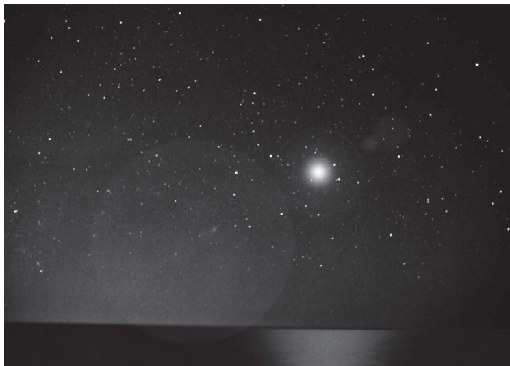
Звезда-гостя на ночном небе