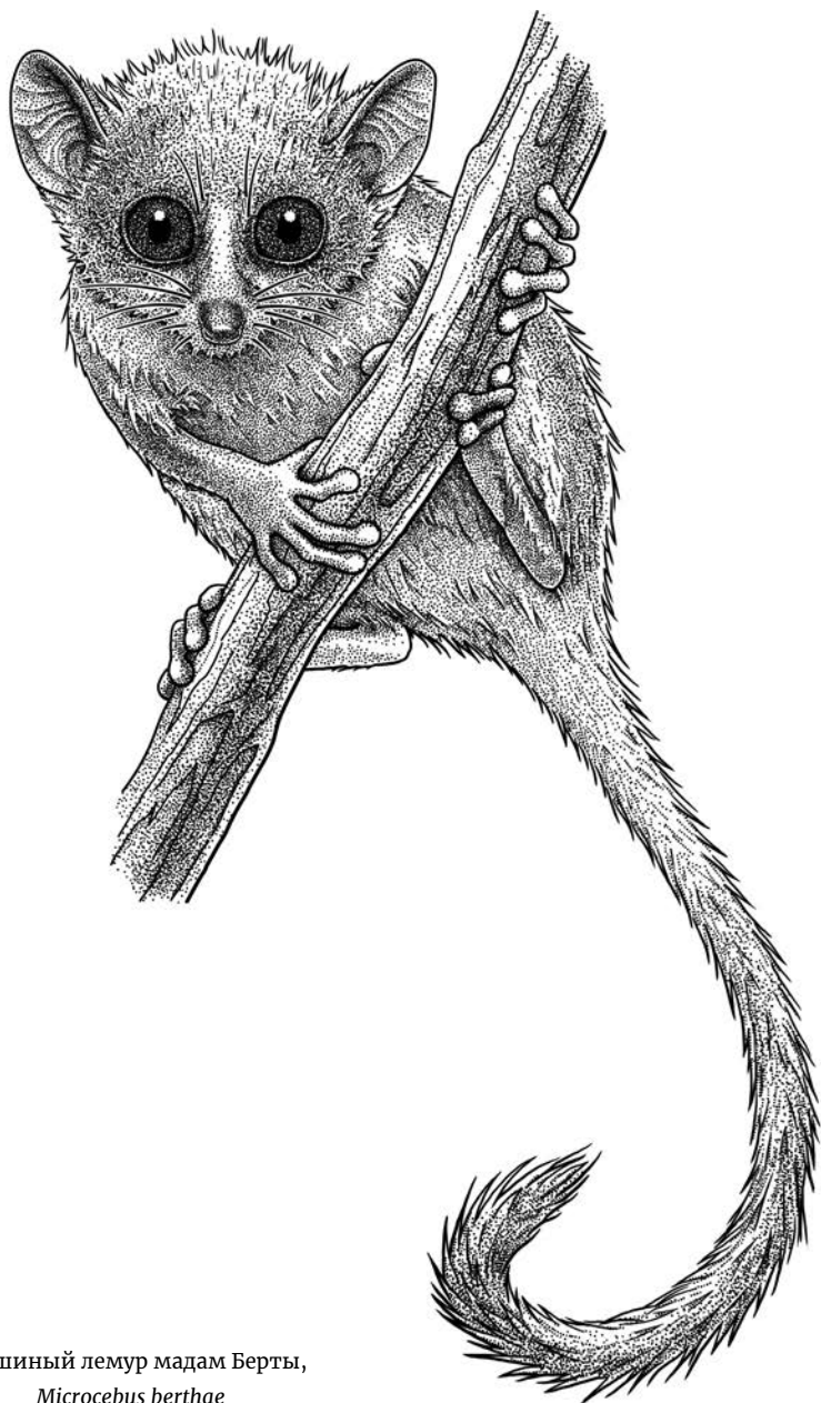
Мышиный лемур мадам Берты, Microcebus berthae