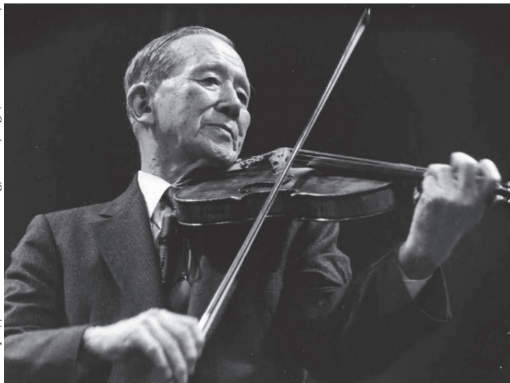
Синити Судзуки (1898-1999), японский скрипач и педагог, автор методики «Воспитания Талантов»

те четырехсот юных скрипачей в Токио побывал великий испанский виолончелист, дирижер и композитор Пабло Казальс. Игра учеников Судзуки привела маэстро в полный восторг. Он был поражен «живыми результатами» обучения по методу Синити Судзуки. Так постепенно о методе стали узнавать в Европе и Америке. А после гастролей Судзуки с детским ансамблем в США в 1964 году началось быстрое распространение его системы по миру. Были основаны Международные Ассоциации Судзуки, началось обучение преподавателей для дальнейшего распространения методики по всему миру. Сейчас заниматься по методу Судзуки можно практически в любой стране мира: