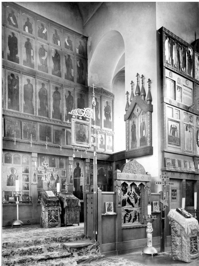
Интерьер храма Знамени на Тверской улице в Санкт-Петербурге. Фотография 1912 года