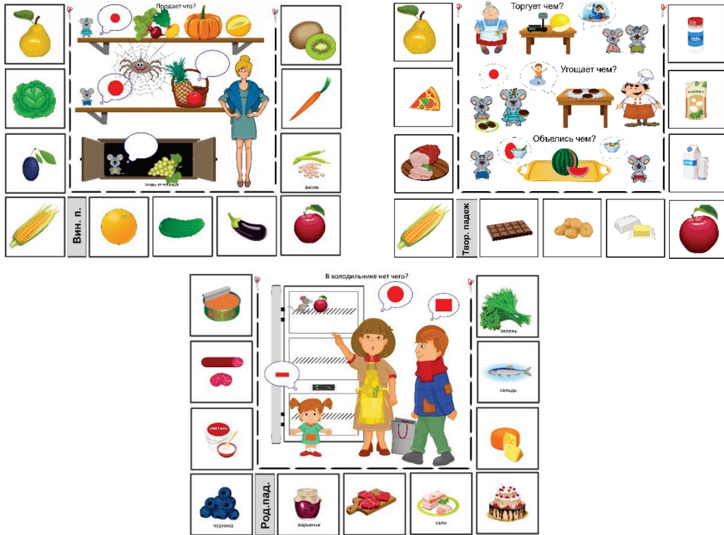
Рис. 3–5. Пример отработки лексических тем «Овощи и фрукты, продукты питания» при склонении существительных