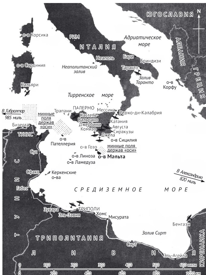
Мальта — объект авиаударов держав «оси»