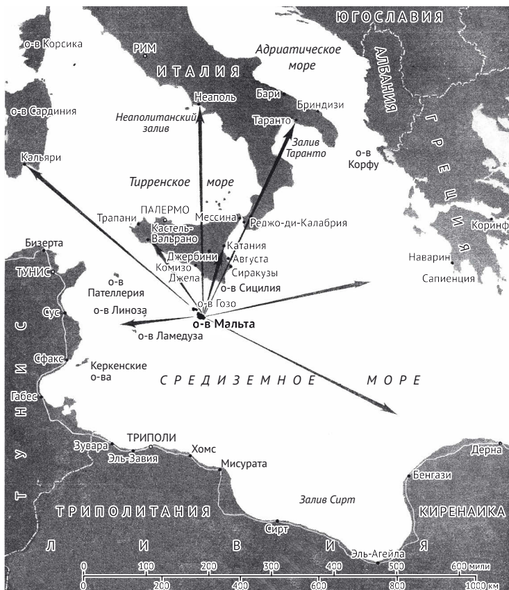
Мальта — оперативная база британских ВВС