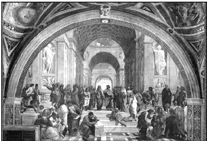
Рафаэль. Афинская школа

ТЕЗИС: ПСИХОЛОГИЯ — ЧАСТЬ ФИЛОСОФСКОЙ КАРТИНЫ МИРА