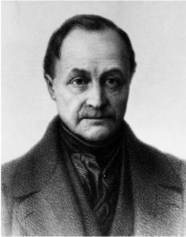
Конт Огюст (1798—1857)

Известный французский философ и исследователь науки в юности был секретарем знаменитого французского социалиста А. Сен-Симона. Затем работал в Политехнической школе в Париже. Оставив преподавательскую деятельность, жил в бедности. Умер в Париже.