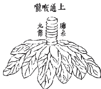
Схема органа цзан легкие 1. Горло; 2. Дыхательные пути; 3. Легкие; 4. Две доли; 5. Шесть лепестков

Запад порождает сухость. Сухость порождает металл, металл порождает легкие, легкие порождают кожу и волосы, кожа и волосы порождают почки. Легкие управляют носом. На небе им соответствует сухость, а на земле они соотносятся с металлом. В теле человека им соответствуют кожа и волосы. Среди органов цзан представлены легкими. Среди звуков им соответствует плач. Среди патологических изменений им соответствует кашель. Среди душевных стремлений им соответствует печаль. Печаль вредит легкими, а радость побеждает печаль. Жар вредит волосам и коже, а холод побеждает жар. Острое вредит волосам и коже, а горькое побеждает острое.