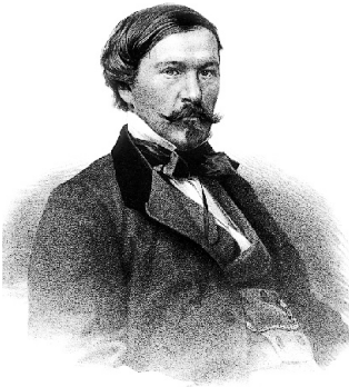
Александр Дружинин. 1850-е годы