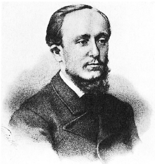
Дмитрий Писарев. 1880-е годы