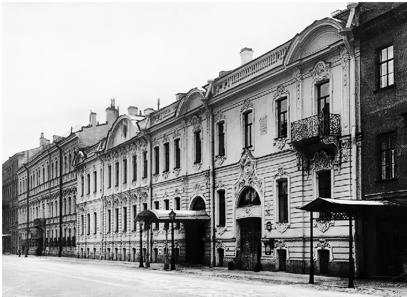
Дом №3 по Моховой улице, где Гончаров жил с 1857 года до своей смерти 15 сентября 1891 года. Санкт-Петербург, 1914 год

это своего рода концентрат, объясняющий всплеск и «погасание» жизни Обломова. Заданный этим сном ритм и становится организующим началом романа, который развивается вовсе не по социальным законам, а согласно годичному природному циклу: выйдя из зимней спячки, весной Обломов встречает Ольгу, их отношения переживают летний расцвет и умирают осенью. Причиной окончания романа становится невозможность переправиться через замерзающую на зиму Неву.