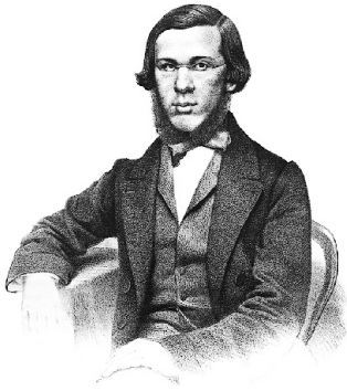
Николай Добролюбов. 1860-е годы