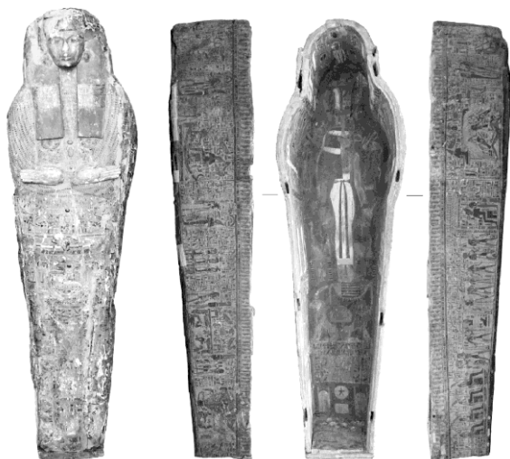
Рис. 2. Саркофаг Несмут, ОАМ № 71695