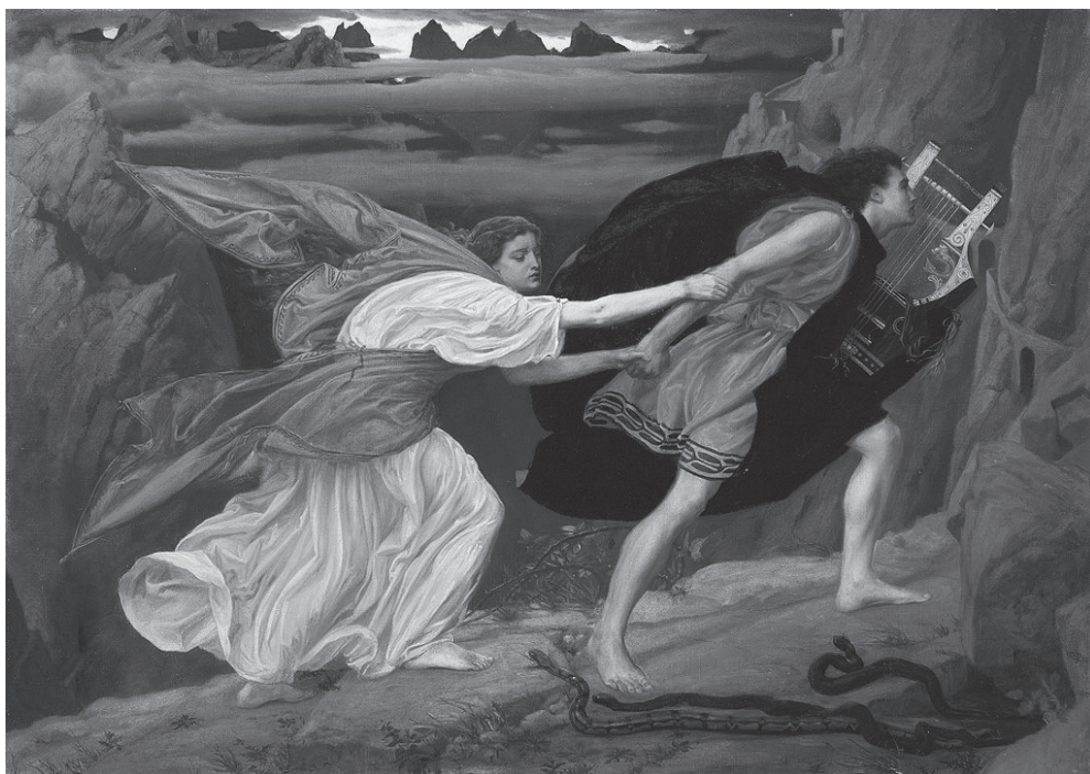
«Орфей и Эвридика» Художник Э. Д. Пойнтер (музей Прадо, Мадрид)

Имя древнегреческого певца Орфея известно уже более двух тысяч лет. Не было равных ему в искусстве пения и игре на лире. Вся природа затихала, услышав волшебный голос певца. Женой Орфея была прекрасная нимфа Эвридика.