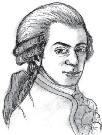
В. А. Моцарт — австрийский композитор (1756–1791)