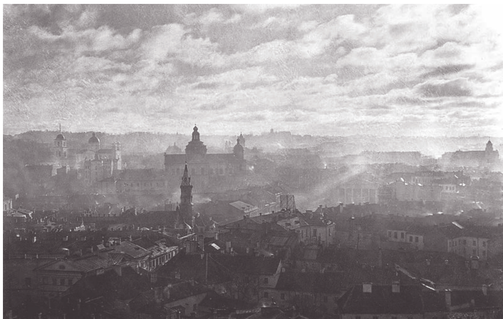
2. «Вильнюс».

к метафоре пути, можно сказать, что в современной Европе, полагающейся на абстрактные числа и статистические выводы, все дороги ведут в Вильнюс. В 1989 году ученые из Национального географического института Франции установили координаты центра европейского континента: 54^{\circ}54' северной широты, 25^{\circ}19' восточной долготы. То есть центр Европы обнаружился на окраине литовской столицы. На этом математическом перекрестке, в двадцати пяти километрах к северу от Вильнюса, пересекаются прямые, прочерченные из крайних точек Европы — с острова Шпицберген на севере, Канарских островов на юге, Азорских на западе и арктического Урала на востоке.