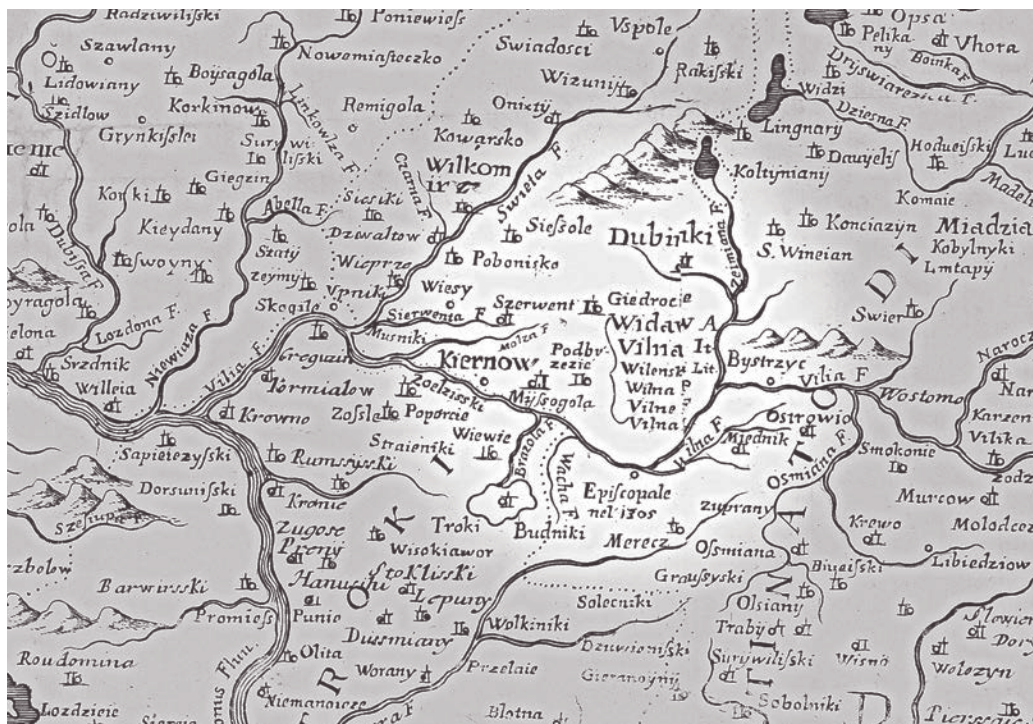
3. Вильнюс на разных языках: по-немецки Widaw, по-итальянски Vilna, по-литовски Wilenski, по-польски Wilna, по-французски Vilne и на латыни Vilna. Фрагмент карты Литвы, изданной в Венеции в 1696 году

европейского повествования, оставляющий его в стороне, будто географический обломок или осколок истории.