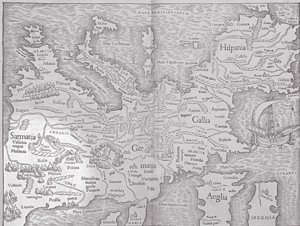
4. «Новая карта Европы». Из «La cosmographie universelle» (1556). Вверху карты — юг Европы; Литва с Ливонией и Пруссией находятся слева внизу, на юго-восточном побережье Маре Germanicum, или Балтийского моря