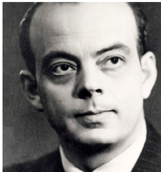
А. де Сент-Экзюпери

Мы знаем и видим, мы осознаем практически с детства, что общество не является однородным. В нем нетрудно обнаружить неравенство. Возьмем, к примеру, известную нам по школьной программе культуру Древней Греции. Ряд сельскохозяйственных общин объединялись в города-государства. Здесь же шла борьба за власть между прежней родоплеменной знатью (аристократами – «лучшими людьми»), новыми богачами (олигархами) и народом. Практически во всех обществах, которые изучают специалисты, существуют богатые и бедные, знатные и незнатные, аристократы и простые людей. Вот почему общество распадается на разные социальные группы, называемые стратами (это понятие заимствовано из геологии. Когда геологи изучают геологические пласты, они могут выделить различные слои. Их называют стратами. В обществе тоже вполне видны эти социальные пласты). Деление общества на разные группы называют социальной стратификацией . При этом можно выделить разные признаки такого членения.