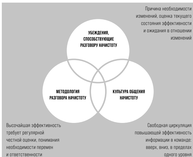
РИСУНОК 1. Что такое разговор начистоту?

Хотя разговор начистоту, как правило, прост, он не обязательно легок. Но мы поможем вам его освоить. На РИСУНКЕ 1 представлена суть разговора начистоту.