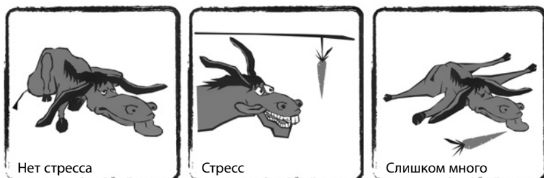
Рис. 1. Стресс и эффективность