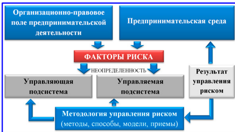
Рис. 2.5. Обобщенная схема СУР

В практике различают два частных варианта системы управления рисками: