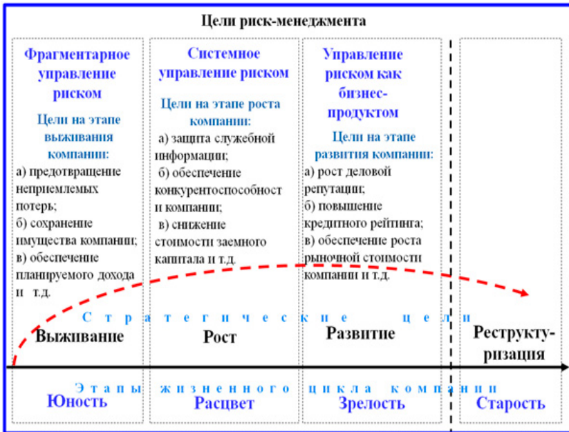
Рис. 2.3. Цели риск менеджмента

Риск-менеджер — специалист, который способен идентифицировать, анализировать, оценивать, документировать риски, контролировать и проводить мониторинг рисков в рамках всей организации, а также в рамках отдельных частей и систем в организациях различных организационно-правовых форм и отраслей деятельности. Риск-менеджер помогает владельцам риска и всем сотрудникам организации, обоснованно и систематически управлять