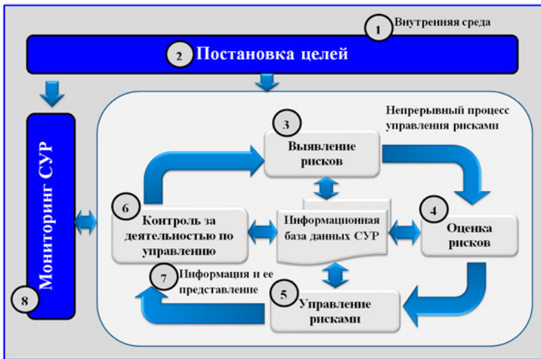
Рис. 2.4. Модель СУР, основанная на концепции управления рисками COSO

Более цельным, структурированным и технологичным на текущий момент представляется модель COSO, схема которой в дополнительной интерпретации представлена далее.