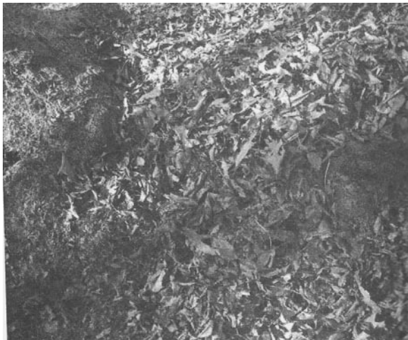
Рис. 1.1. Мумифицированные трупы животных и органический мусор