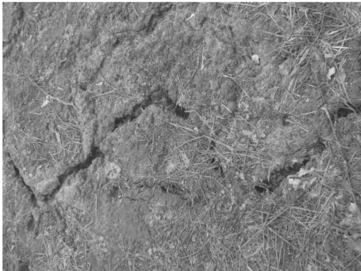
Рис. 1.3. Необработанный отходами участок почвы