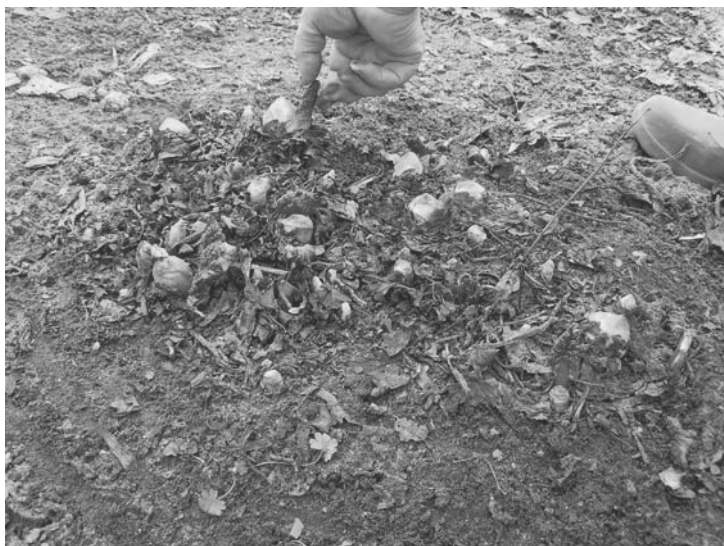
Рис. 1.4. Та же клумба на следующий год после мульчирования почвы