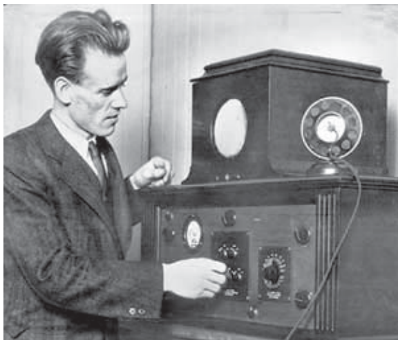
Первая в истории электронная видеоигра «Cathode-Ray Tube Amusement Device»

К сожалению, самый первый «аркадный автомат» не сохранился. Аппарат так и не появился в продаже и не производился кроме как для показа в узком академическом кругу ученых. Его разобрали в 1951 году, когда для научных целей понадобились какие-то детали, из которых состоял аппарат.