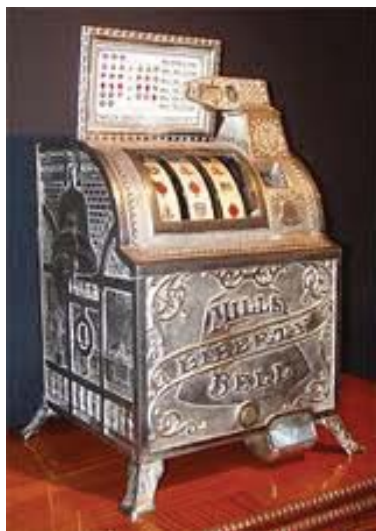
Игровой автоматический аппарат Mills Liberty Bell (1907)

Покерные слот-машины, изобретенные в 1891 году в штате Нью-Йорк (США), за короткое время стали очень популярны и быстро распространились и по другим американским штатам.