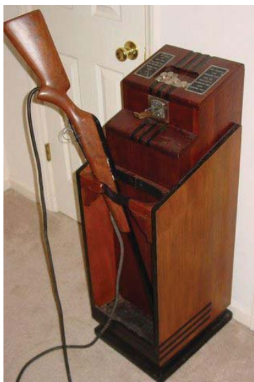
Механический аппарат Seeburg Ray-O-Lite

Физики запатентовали первое в мире игровое электронное устройство – «Cathode-Ray Tube Amusement Device» , которое было размером примерно со шкаф и не издавало никаких звуков, кроме электрических шумов работающих ламп. 25 января 1947 года был выдан патент U.S. Patent #2 455 992. Этот день считается официальной датой рождения электронных видеоигр.