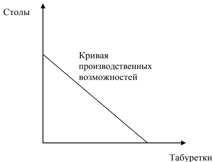
Рис. 1. Кривая производственных возможностей двух товаров

№2. Технология позволяет производить 2 табуретки за 1 чел.·ч и 3 стола за 2 чел.·ч. Определите: