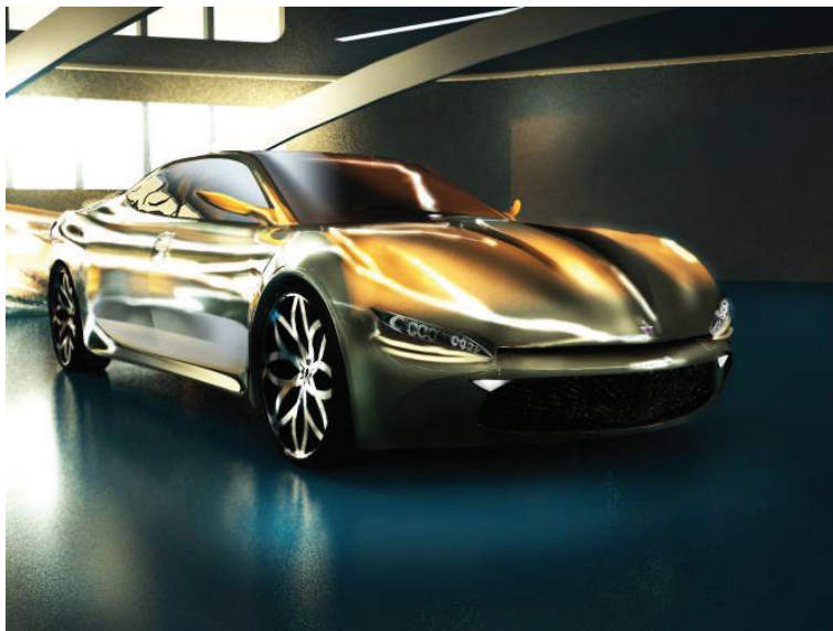
Рис. 1.16. Визуализация концептуальной модели автомобиля Lotos

Выводы. Изготовление предметов и объектов в нашем окружении начинается с разработки концепции, создания прототипа [Норман, 2006], [Рунге, Манусевич, 2005]. В результате моделирования можно отметить, что концепция автомобиля Lotos с помощью современных систем моделирования была воплощена в жизнь, начиная от эскизных набросков до реалистичной визуализации [Аббасов и др., 2014].