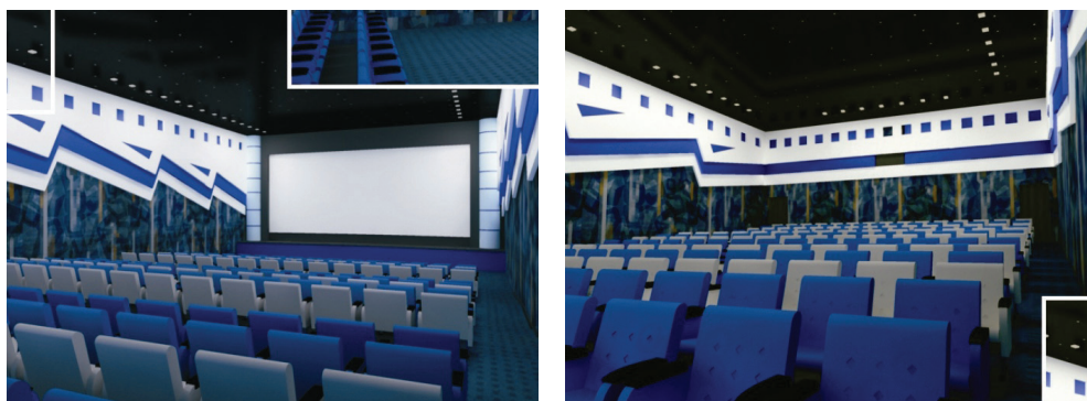
Рис. 1.9. Реконструкция зала просмотра кинотеатра (виды из зала и со сцены)

На рис. 1.9 приведена визуализация реконструированного зала просмотра кинотеатра. Для создания настенных панелей (в виде ленточной перфорации) использовался метод выдавливания, кресла были сформированы из примитива Вох (Параллелепипед) с дальнейшим полигонным выдавливанием. Арматура кресел смоделирована с использованием примитивов и лофтинговых объектов.