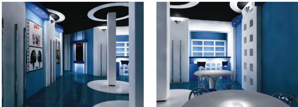
Рис. 1.8. Реконструированный интерьер холла кинотеатра с баром (справа)

На рис. 1.9 приведена визуализация реконструированного зала просмотра кинотеатра. Для создания настенных панелей (в виде ленточной перфорации) использовался метод выдавливания, кресла были сформированы из примитива Вох (Параллелепипед) с дальнейшим полигонным выдавливанием. Арматура кресел смоделирована с использованием примитивов и лофтинговых объектов.