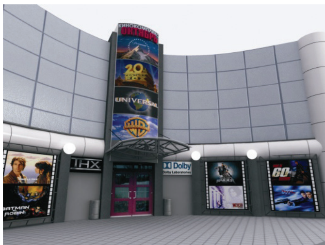
Рис. 1.11. Реконструированный фасад здания кинотеатра «Октябрь»

На рис. 1.11 представлена визуализация реконструированного фасада кинотеатра [Аббасов, Орехов, 2006]. Для моделирования составных частей сцены использовались трехмерные примитивы и модификаторы для выдавливания и лотфинга.