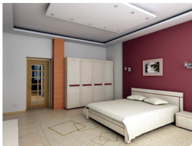
Рис. 1.4. Вид спальни на первом этаже