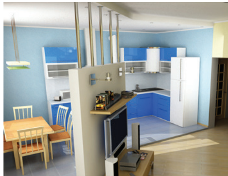
Рис. 1.3. Вид кухни-столовой

Компьютерное моделирование. Кухня выполнена достаточно лаконично, контрастирует с гостиной, обилием синих, голубых тонов, это не снижает ее функциональности. Вид кухни-столовой представлен на рис. 1.3. На кухне располагается мощная вытяжка, встроенная бытовая техника, спрятанный отопительный котел.