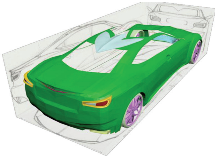
Рис. 1.13. Построение трехмерной модели кузова на основе эскизов

Компьютерное моделирование. На следующем этапе выполняется прорисовка модели с привязкой к биометрическим параметрам человека с учетом требований эргономики (рис. 1.13). После этого наступает этап моделирования на основе эскизного проекта [Аббасов, 2013]. В данной работе для моделирования будет использоваться графическая система трехмерного моделирования 3ds Max. Графическая система 3ds Max является гибким и многогранным программным продуктом, предоставляющим пользователю большой простор для работы [Аббасов, 2010]. Для создания модели автомобиля используется метод полигонального выдавливания. Эскизные чертежи концептуальной модели располагаются на плоскостях проекций, как на рис. 1.13. В соответствии с проекцией кузова автомобиля создается поверхность объекта.