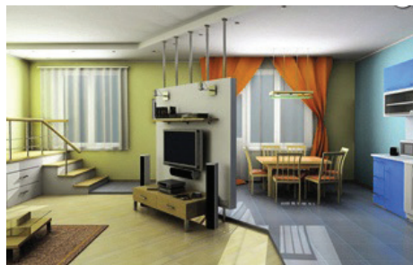
Рис. 1.5. Вид гостиной-столовой

Выводы. Следует отметить, что преимуществом компьютерного моделирования при проектировании интерьера является возможность наглядного просмотра сцены до его создания и мобильность при изменении цветового оформления.