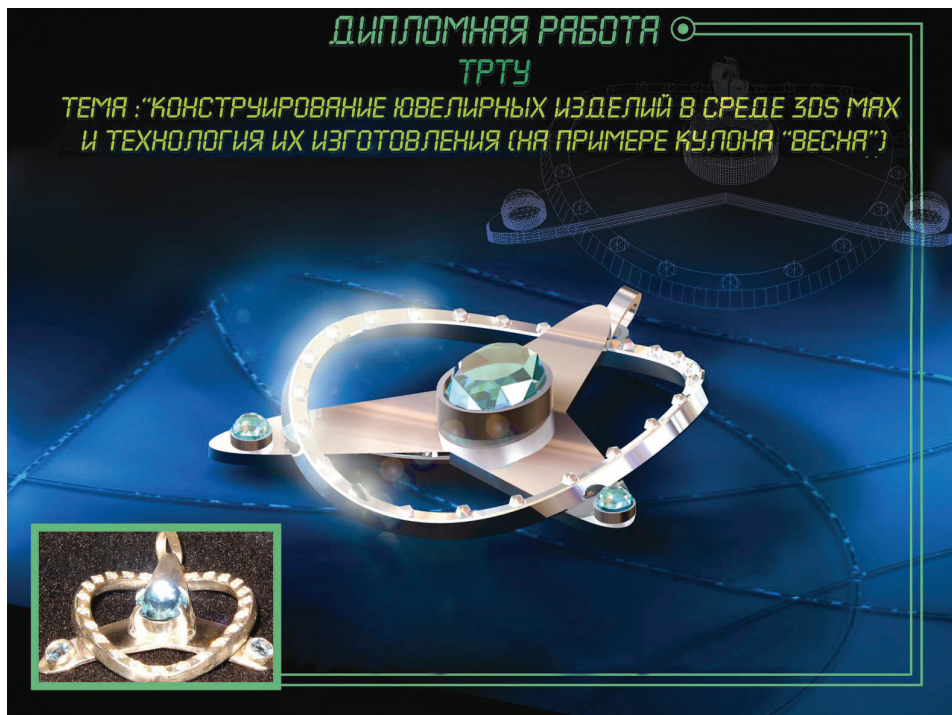
Рис. 1.1. Трехмерная компьютерная модель и фотография кулона «Весна»

Выводы. Кулон «Весна» прекрасно сочетается с современными модными костюмами, подчеркивает индивидуальность и будет пользоваться популярностью у молодежи, которая любит менять украшения, но, как правило, ограничена в средствах для приобретения дорогих украшений из золота, и у творческих людей, которые ценят новизну и не признают стандарты.