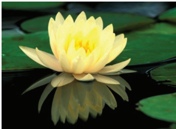
Рис. 1.12. Цветок лотоса

Концепция дизайна разрабатываемой модели автомобиля была обусловлена цветком лотоса (рис. 1.12). Лотос (лат. nelumbo ) относится к роду двудольных растений, единственный представитель семейства лotosовых [Цветок лотос. сайт, 2013], [Уолтерс, 2001]. Учитывая, что дизайн автомобиля вдохновлен этим прекрасным цветком, в его формах угадывается бионическая форма лепестков лотоса. В культуре многих древних цивилизаций лотос означает бессмертие и божественное начало, перерождение и солнце, неисчерпаемую энергию и духовную силу.