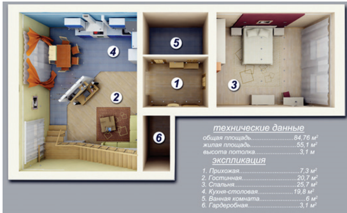
Рис. 1.2. План первого этажа

Компьютерное моделирование. Кухня выполнена достаточно лаконично, контрастирует с гостиной, обилием синих, голубых тонов, это не снижает ее функциональности. Вид кухни-столовой представлен на рис. 1.3. На кухне располагается мощная вытяжка, встроенная бытовая техника, спрятанный отопительный котел.