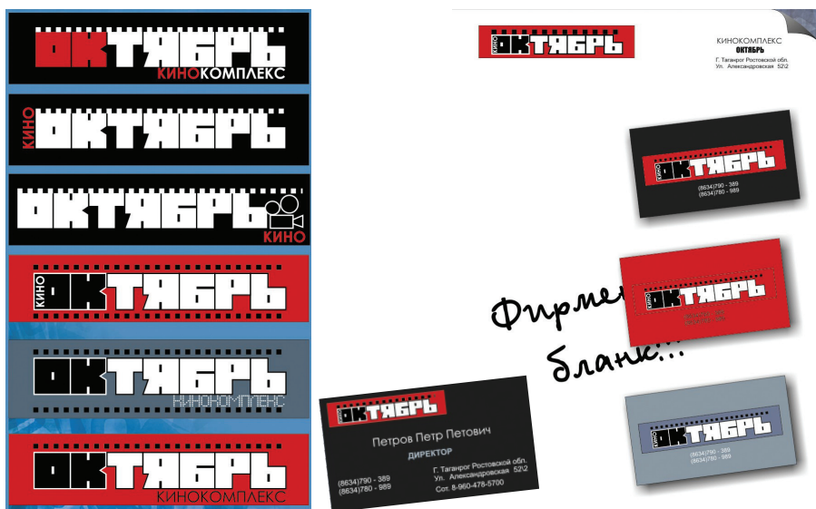
Рис. 1.10. Элементы фирменного стиля: логотип, визитка, фирменный бланк

На рис. 1.11 представлена визуализация реконструированного фасада кинотеатра [Аббасов, Орехов, 2006]. Для моделирования составных частей сцены использовались трехмерные примитивы и модификаторы для выдавливания и лотфинга.