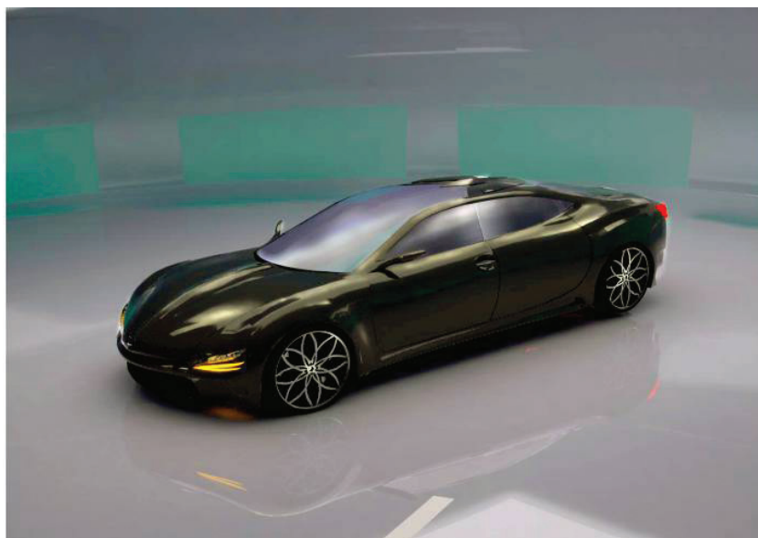
Рис. 1.15. Визуализация концептуальной модели автомобиля Lotos

Следующим шагом проектирования является тонирование и визуализация построенной модели. Процесс назначения материалов отдельным конструктивным частям автомобиля осуществляется на уровне полигонов. После проведенных операций можно получить готовую модель для дальнейшей визуализации с помощью реалистичных моделей освещения. Для визуализации используется встраиваемый модуль V-Ray. На рис. 1.15 и 1.16 представлены окончательные сцены визуализации тонированной концептуальной модели автомобиля Lotos.