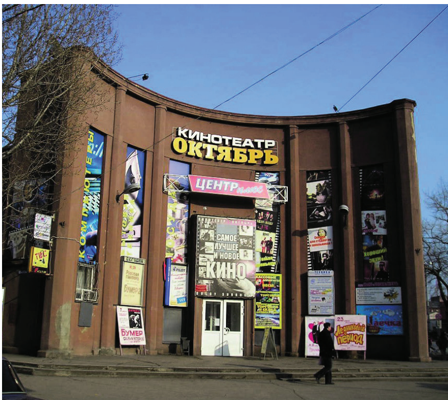
Рис. 1.7. Современный фасад здания кинотеатра «Октябрь»

Трехмерное моделирование. Современный вид фасада кинотеатра «Октябрь» представлен на рис. 1.7. Для реконструкции будут созданы модели фасада кинотеатра, а также из внутренних помещений: интерьер холла с баром и зала просмотра.