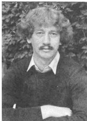
Автор в 1980 г., когда он писал «Политику у шимпанзе»