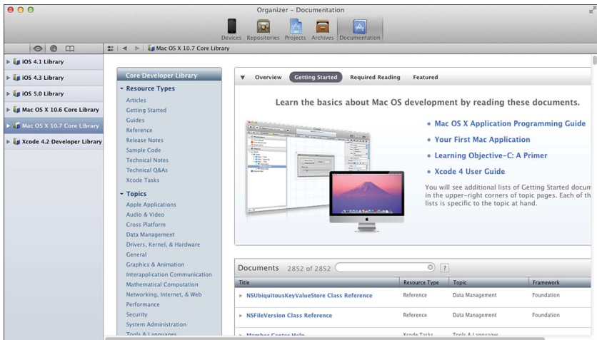
Рис. 0.1. Домашняя страница библиотеки Mac OS X 10.7 Core Library в программе просмотра документации, встроенной в Xcode

Вместо этого мы рекомендуем подружиться с обозревателем документации, встроенным в Xcode (если вы еще этого не сделали). В Xcode 4.2 для доступа к нему нужно выбрать из меню пункт Help ⇒ Documentation and API Reference – при этом окно организатора открывается на вкладке Documentation. При первом заходе вы увидите экран Quick Start, на котором представлены ссылки на ресурсы, посвященные знакомству с Xcode. В правой панели имеются кнопки для обзора, поиска и управления закладками. Кнопка Browse позволяет выбрать активные наборы документов верхнего уровня. На рис. 0.1 показана домашняя страница библиотеки Mac OS X 10.7 Core Library.