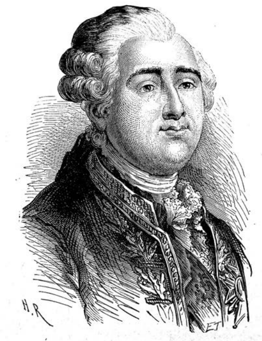
Людовик XVI. Гравюра Э. Тома с портрета работы А. Руссо

XVIII столетия самыми разными странами, переживающими в наши дни радикальные перемены, не хватит и книги.