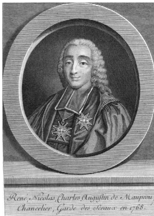
Рене Николя де Мопу. Гравюра XVIII в.

препона с их пути устранена, но... 10 мая 1774 года Людовик XV скоропостижно скончался от оспы.