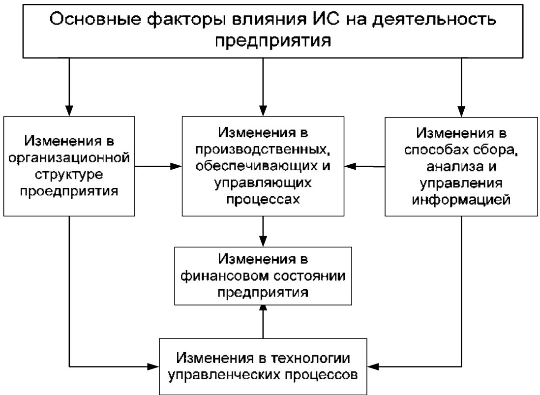
Рисунок 1. Основные факторы влияния ИС на деятельность предприятия

Совокупная эффективность ИС представляет собой синергетический эффект от суперпозиции (наложения) перечисленных локальных эффектов.