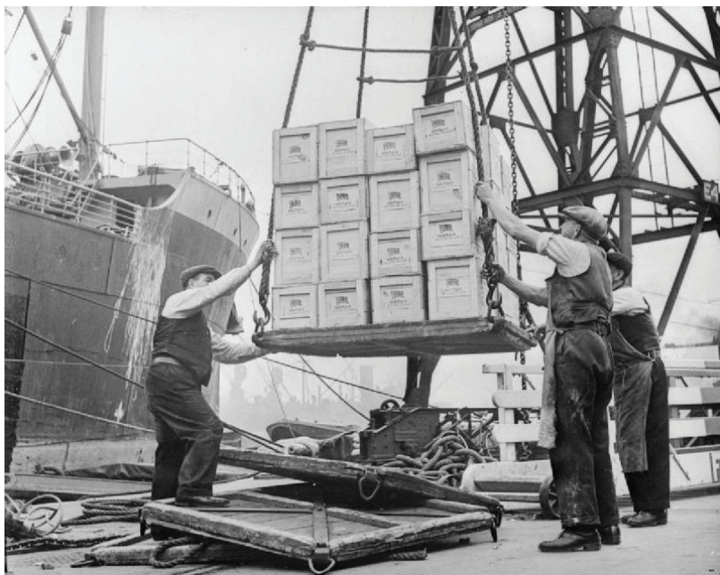
Рис. 1.3. Работа докеров в порту Бристоля (Англия) в 1940 году

При транспортировке грузов используются разнообразные средства, включая трейлеры, автопогрузчики, краны, поезда и корабли. Эти средства должны обладать возможностями работы с широким спектром грузов различных размеров и соблюдать многочисленные специальные требования (например, при транспортировке упаковок кофе, бочек с опасными химикатами, коробок с электронными товарами, парков дорогих автомобилей и стеллажей с замороженными мясными продуктами). На протяжении многих лет это был тяжелый и дорогостоящий процесс, требующий больших трудозатрат многих людей, в том числе и портовых докеров, для погрузки и выгрузки вручную различных предметов в каждом транзитном пункте (рис. 1.3).