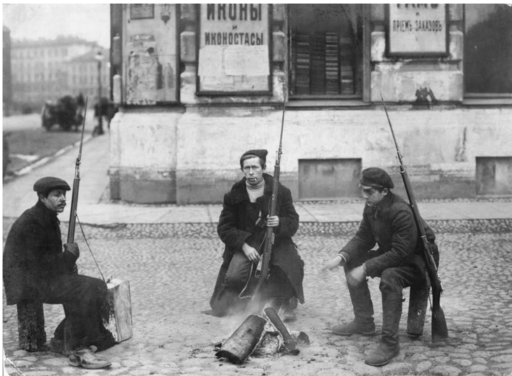
Красногвардейцы у костра в дни Октябрьской революции. Петроград, октябрь 1917 года