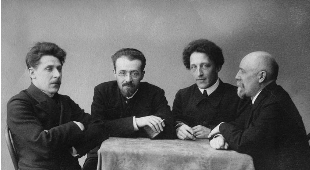
Поэты-символисты (слева направо): Георгий Чулков, Константин Эрберг, Александр Блок и Фёдор Сологуб. Около 1920 года

цитируются, пародируются многие культурные контексты революционной России — от политических лозунгов до нового, выплеснувшегося на улицу жаргона. На самый сложный образ поэмы — появляющегося в финале Христа — повлияло много факторов. Здесь и личная история богоискательства Блока, которое формировалось в общении с Дмитрием Мережковским, Андреем Белым, Ивановым-Разумником*, и хорошо знакомые Блоку тексты (например, «Жизнь Иисуса» Эрнеста Ренана, где Христос выведен революционером-анархистом), и мистическое представление о революции, обновляющей мир подобно новейшему Завету.