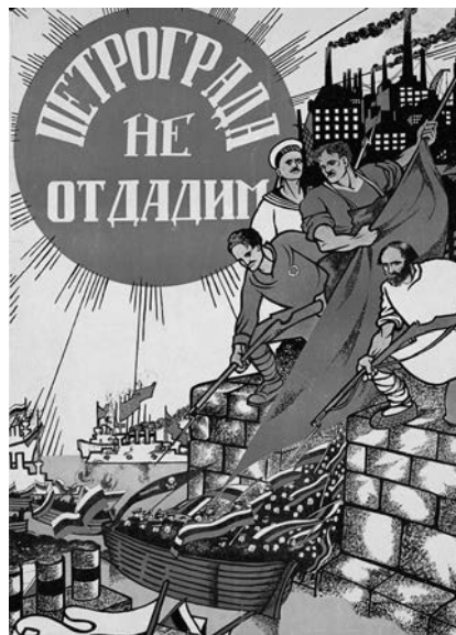
Дмитрий Моор. Петрограда не отдадим. 1919 год

Несмотря на всё это, уже ранние исследователи отмечали, что «Двенадцать» связана с прочим творчеством Блока неразрывно. Образы Христа и Катюшки нельзя вполне понять без обращения к ранним текстам Блока, вплоть до «Стихов о Прекрасной Даме». В «Двенадцати» есть по крайней мере одна глава, ритмом и звучанием отчётливо напоминающая прежнего Блока: «Не слышно шуму городского...» Близость этой главы к романсу выглядит на фоне «привычного» Блока пародией. Можно предположить, что Блок пародирует собственную прежнюю поэтику — а если смотреть шире, то и романтическую поэтику вообще: ведь вся глава — аллюзия на стихотворение Фёдора Глинки «Песнь узника». Первые две строки — почти дословная цитата из Глинки: «Не слышно шуму городского, / В заневских башнях тишина! / И на штыке у часового / Горит полночная луна!» (Глинка); «Не слышно шуму городского, / Над невской башней тишина, / И больше нет городского: / Гуляй, ребята, без вина!» (Блок). В стихотворении Глинки узник просит милости у царя; американская переводчица и комментатор «Двенадцати» Мария