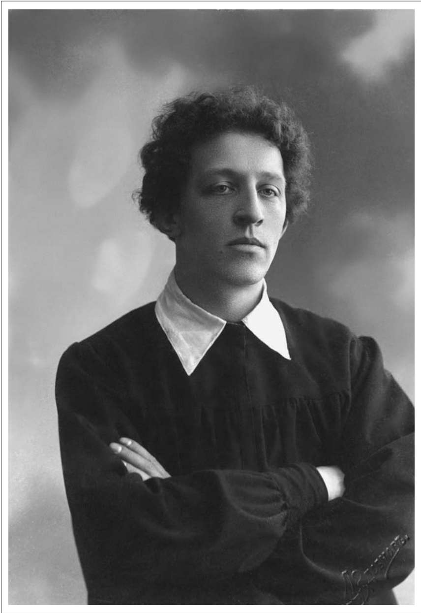
Александр Блок. Около 1900 года