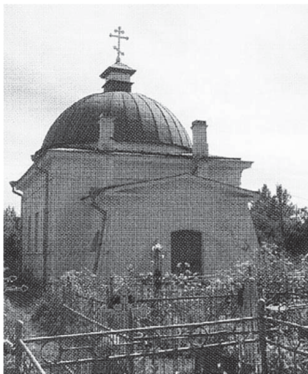
Церковь св. Иоанна Златоуста Староладожского Никольского монастыря

Вместе с тем среди наиболее значительных проводников христианства на землях Приладожья и Русского Севера в целом было немало представителей коренных этносов. В числе наиболее выдающихся, совершивших немало духовных подвигов и причислен-