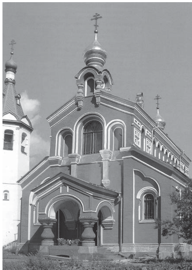
Кладбищенская церковь Староладожского Успенского монастыря

Возникшие в тот период нигилистические этнокультурные настроения сохранились надолго. Помнится, как нам во время экспедиции в деревни Нюрговичи, Вонозеро, Шигола и др. местные учителя говорили, что не разрешают ученикам в школе (даже во время перемен) разговаривать между собой по-вепски, дабы у них не было потом вепского акцента и других проблем при дальнейшем образовании и производственной деятельности. Распространялись в широком быту и мифы о том, что вепсы на самом деле не отдельный народ, а лишь «офиннизированные русские», хотя, особенно в семьях потомков вепской интеллигенции, бывших учителей и клубных работников, некое потаенное чувство и уважение к своей идентичности оставалось. Припоминается, как в 1970-х гг.