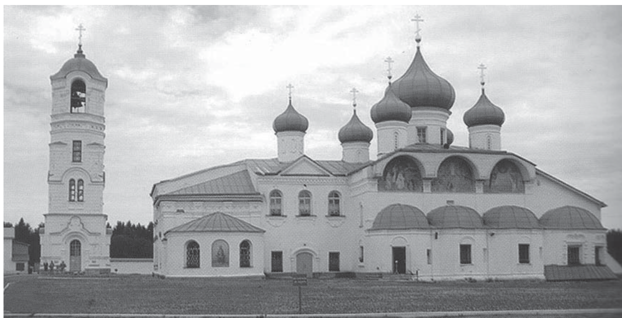
Троицкий собор Александро-Свирского Свято-Троицкого монастыря

Цит. по: [112: 58]). Поэтому для успешного распространения православия среди инородцев «...необходимо было позаботиться об их обрусении прежде, чем их крещении <...> сделавшись русскими, они, так сказать eo ipso (тем самым) получают возможность сделаться христианами» [36].