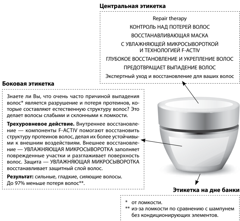
Рис. 2. Содержание этикеток, помещенных на упаковку маски для волос от известного производителя

лысеющих мужчин, которым эта маска для волос вряд ли поможет.