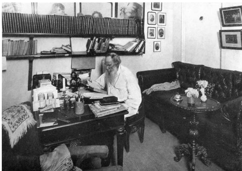
Лев Толстой за работой в Ясной Поляне

Толстой упорствовал. Он даже достал из ящика стола незаконченный роман «Воскресение» и принялся за старое: вместо