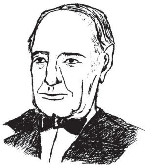
Ортега-и-Гассет Хосе (1883–1955)