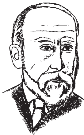
Дильтей Вильгельм (1833–1911)

в-третьих, организовано в стройную логически непротиворечивую систему воззрений и жизненного опыта. Философия, по сути, формирует мировоззрение.