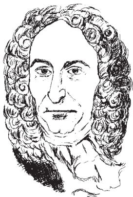
Лейбниц Готфрид Вильгельм (1646–1716)

тегрированно, монолитно, но внутренне индивидуалистично, рассогласованно. Сознание человека отпускается в свободный полет по информационному пространству, но при этом оно не в состоянии определить свои истоки. В условиях ожидания случайной информации сознание человека отвыкает трудиться над созданием личности, перестает быть направленным на восприятие внутренних переживаний. Главным состоянием человека становится «праздность души».