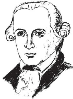
Кант Иммануил (1724–1804)