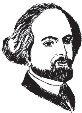
Бердяев Николай Александрович (1874–1948)

сторон. Поэтому философия есть самая незащищенная сторона культуры. Постоянно подвергается сомнениям сама возможность философии, и каждый философ принужден начинать свое дело с защиты философии и оправдания ее возможности и плодотворности. Философия подвергается нападению сверху и снизу, ей враждебна религия и ей враждебна наука. Она совсем не пользуется тем, что называется общественным престижем. Философ совсем не производит впечатления человека, исполняющего социальный заказ 5 .