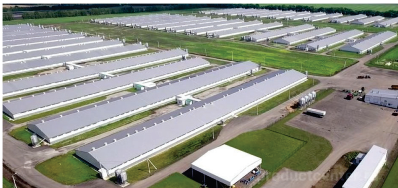
Рис. 2. Современный свиноводческий комплекс агрохолдинга «Мираторг» АПК Белогорья

Министр сельского хозяйства, выступая с докладом о предварительных итогах реализации приоритетного национального проекта «Развитие АПК» в 2006–2007 гг. на заседании Президиума Совета при Президенте Российской Федерации 25 декабря 2007 г., заявил, что на решение задач в этой сфере привлекли более 191 млрд рублей. Это позволило начать строительство, реконструкцию и модернизацию 2140 животноводческих комплексов на основе самых передовых технологий, которые «по своим масштабам и эффективности не только не уступают, но и зачастую превосходят зарубежные аналоги» 5 .