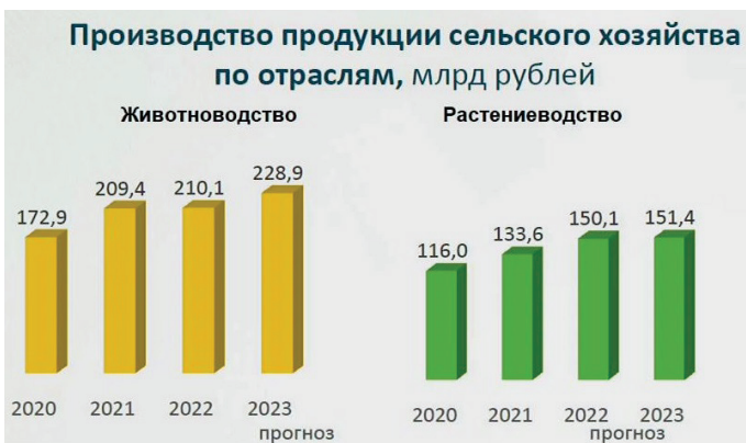
Рис. 7. Развитие животноводства и растениеводства Белгородской области в 2020–2023 гг.

Если пересчитать произведенные в регионе продукты питания из натурального сырья, в том числе молока, масла растительного и мяса, и сравнить их с нормами, рекомендованными Минздравом РФ для потребления средним россиянином, то картина будет выглядеть следующим образом.