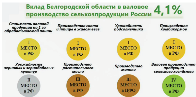
Рис. 1. Вклад Белгородской области в валовое производство сельхозпродукции России

Вклад АПК Белгородчины в решение продовольственной проблемы страны наглядно виден на следующей диаграмме.