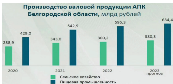
Рис. 5. Рост производства в сельском хозяйстве и пищевой промышленности Белгородской области в 2020–2023 гг.

Еще более внушительные показатели труженики Белогорья продемонстрировали в 2022 г. Это следует из доклада Министра сельского хозяйства области на еженедельном оперативном совещании Правительства области от 13 февраля 2023 г. Вот фрагменты одного из слайдов, демонстрировавшегося на совещании, посвященном итогам работы АПК в 2022 г. и задачах на 2023 г.