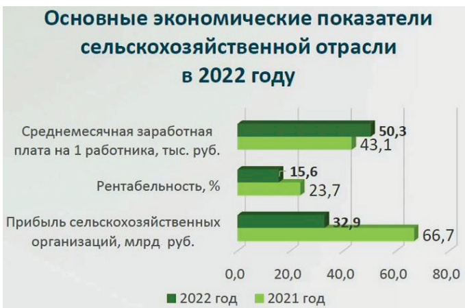
Рис. 6. Прибыль сельхозорганизаций и рост зарплаты в 2021 и 2022 годах в регионе