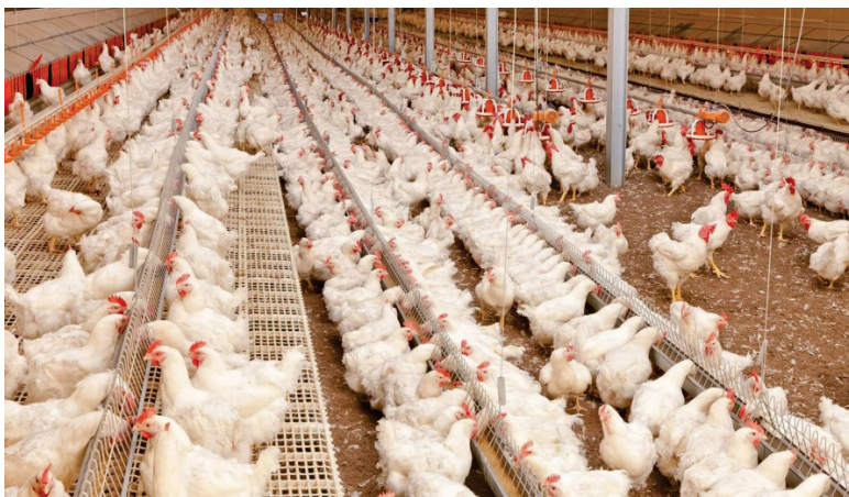
Рис. 3. Птицефабрика агрохолдинга «Ясные Зори» (Белгородский район)

Но не только огромными объемами произведенной свинины могут гордиться животноводы Белогорья. Они добились высоких результатов также в птицеводстве, выращивая ежегодно свыше 40 млн голов птицы. По производству мяса птицы АПК Белогорья и сегодня занимает 1-е место в Российской Федерации с рекордным показателем 818 тыс. тонн (по итогам 2022 г.).