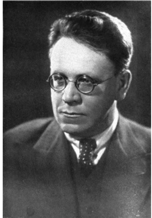
Самуил Яковлевич Маршак на Всесоюзном съезде писателей, 1934 год.

Поначалу Самуил Яковлевич часто просил Матвея Бронштейна изменить тексты для книги, поскольку написаны они были «сухим» научным языком с большим количеством специальных терминов. Не сразу работа пошла гладко, но Маршак умел увлекать людей, а очеред-