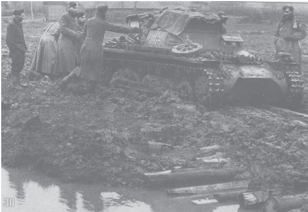
Танк Pz.Kpfw.I под Москвой. Октябрь 1941 года.

Профессор Бернд Бонвеч 1 , немецкий историк, указывает на то, что решение о нападении на СССР было принято после французской кампании вермахта: летом-осенью 1940 года. Почему же тогда фюрер не напал на СССР ещё весной, чтобы иметь запас времени для своего блицкрига? Более того, перенес срок нападения более чем на месяц. Ведь первоначально оно было намечено на 15 мая 1941 года (об этом много пишут). Казалось бы, дата идеальная: и дороги уже подсохли после весны, и противнику меньше времени на подготовку будет. Так в чём же было дело?