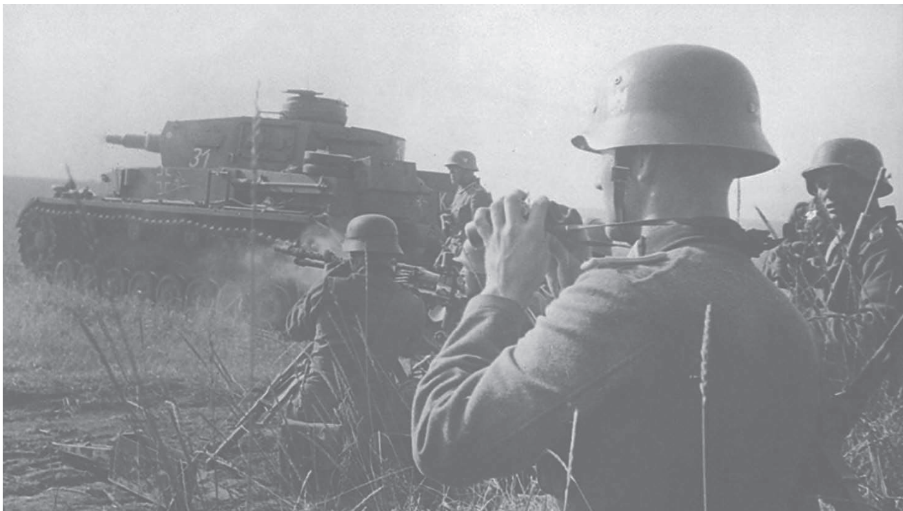
Двадцать второе июня 1941 года.