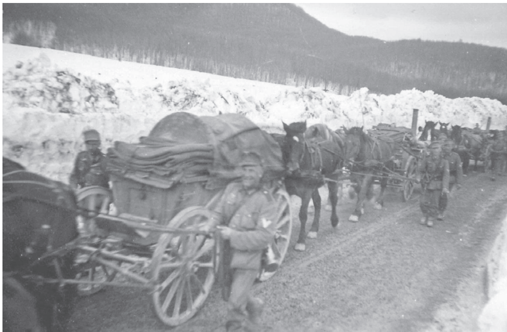
Гужева повозка вермахта.

Югославии и Греции, вышел приказ с конкретной датой нападения на СССР, 22 июня. Семнадцатого июня развёрнутые у границ с Советским Союзом войска получили кодовый сигнал «Дортмунд» и начали выдвижение на исходные позиции.