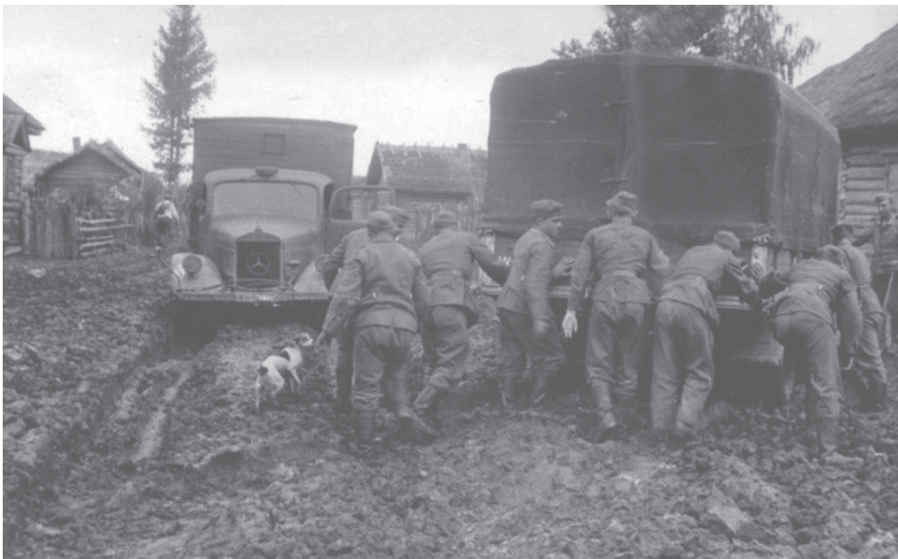
Октябрьская распутица, 1941 год.