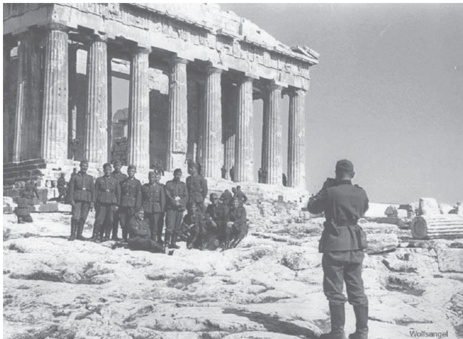
Немецкие солдаты в Афинах.

Достаточно вспомнить, как были укомплектованы войска, и я сейчас имею в виду не только танки без топлива: некомплект транспорта в тылу 40 %-45 %, артиллерийские и противотанковые части (те самые, которые в теории могли остановить танки Гудериана и Гота) укомплектованы тягачами и тракторами на 7 %-10 % (за очень редким исключением), большие проблемы с наличием радиостанций и связью в целом, а танковые дивизии на 80 %-83 % состояли из устаревших моделей. Такая ситуация негативна даже для армии в мирное время, а мы говорим про теорию, в которой армия должна была захватить Европу, что наводит на мысли о несостоятельности данной версии. Такая армия просто не смогла бы проводить глубокие наступательные операции. В реальности же война с Германией считалась неизбежной, и подготовка к ней шла уже более полугода, но в плановом порядке.