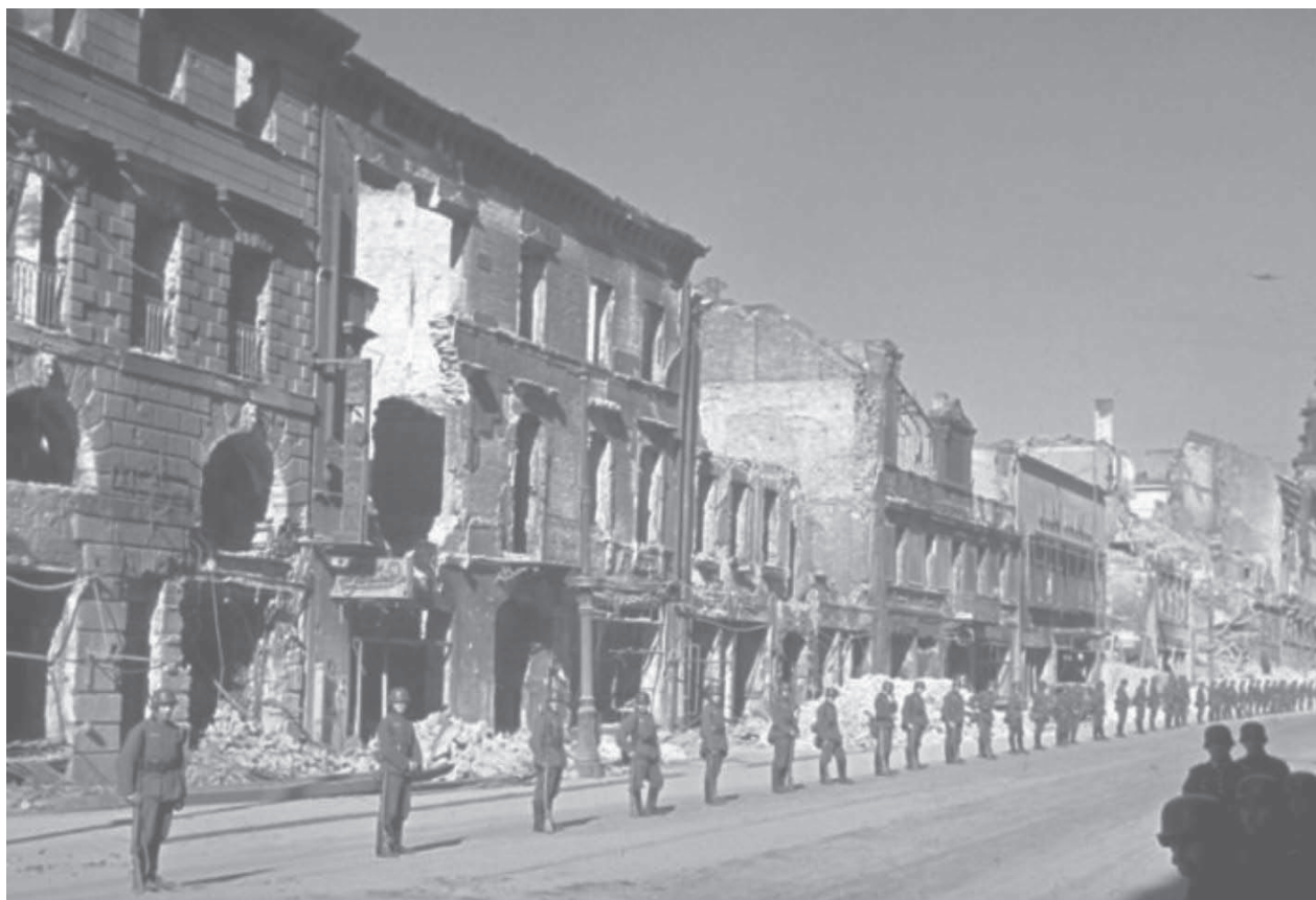
Разрушенная немцами Варшава. Польша, 1939 год.

цев. В 1940-м, когда к ним пришли немцы, французы не стали драться. Они решили, что проще и дешевле будет сдаться. Сами сделали такой выбор.