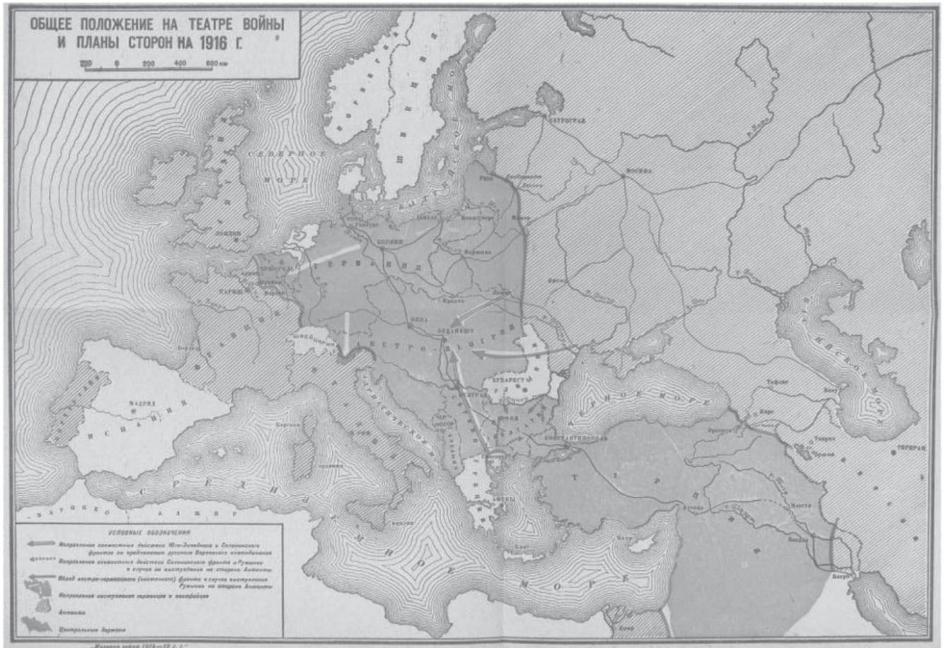
Германия была зажата между противниками в годы Первой мировой войны 1 .