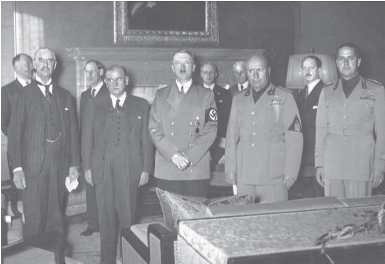
Участники Мюнхенского сговора. Слева направо: Невилл Чемберлен, Эдуар Даладье, Адольф Гитлер, Бенито Муссолини и Галеаццо Чиано.

ров рейха: «Мы, солдаты, просто выполняли свой долг, мирных жителей пальцем не трогали и не знали о том, что творилось в концлагерях».