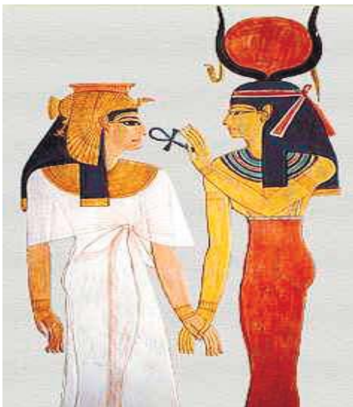
Рис. 4. Примеры костюма царицы Древнего Египта. Изображение царицы Нефертари Меренмут. Хатхор вручает царице Нефертари анх, символ вечной жизни. Сцена из гробницы Нефертари (XIV в. до н. э.)

или, в некоторых случаях, непосредственно боги, могли быть изображены в символе картуша. Картуш, или шем, первоначально был круглой формы, и стал продолговатым через несколько столетий, вероятно, приспособляясь под более длинные имена поздних фараонов. Очертание картуша – канат, окружающий имя фараона, привязанный одним концом. Это символизировало божественную роль фараона по отношению ко всему, что есть во вселенной.