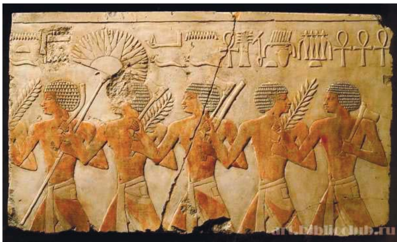
Рис. 2. Пример мужского костюма Древнего Египта. Фрески из храма Хатшепсут. Дейр-эль-Бахри. (нач. XV в. до н. э.) (Из открытых источников)

Мужской костюм. Схенти в период Древнего царства была основной одеждой мужчин. Это набедренная повязка различной длины и различным образом драпированная в зависимости от статуса владельца. У жрецов и знати набедренная повязка переходила в подобие юбки с запахом спереди. Центральная часть такой одежды драпировалась, иногда в виде треугольника. Наиболее распространенная форма схенти – расширенная книзу трапеция. На талии схенти завязывалась поясом – тонким декорированным ремешком или лентой, завязанной на талии спереди в центре. В период Среднего царства мужской костюм состоял из нескольких тонких схенти, которые надевались один на другой.