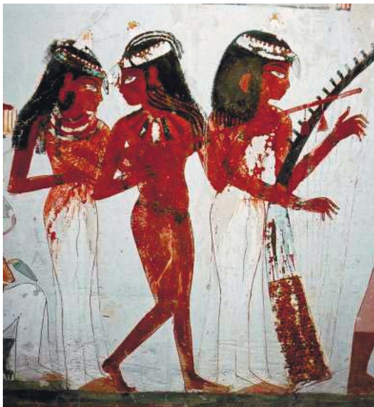
Рис. 3. Пример женского костюма в Древнем Египте. Музыкантши. Фрагмент росписи гробницы Нахт в Фивах (XV в. до н. э.)

Композиция женского костюма строилась на сочетании смуглой кожи, просвечивающей сквозь тончайшую красивую ткань.