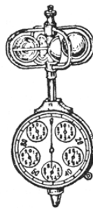
Рис. 1.2. Чашечный анемометр