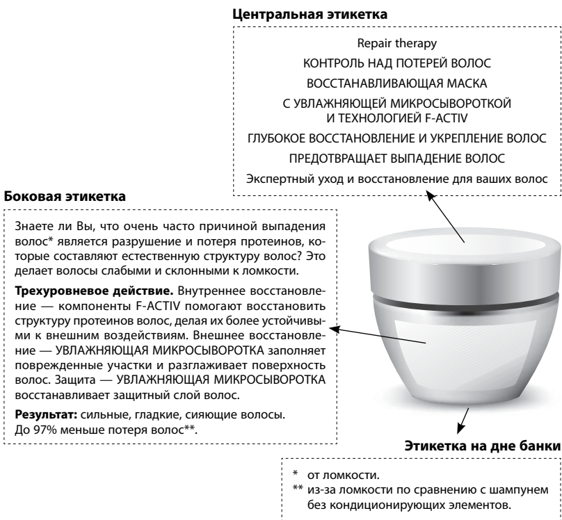
Рис. 2. Содержание этикеток, помещенных на упаковку маски для волос от известного производителя

лысеющих мужчин, которым эта маска для волос вряд ли поможет.