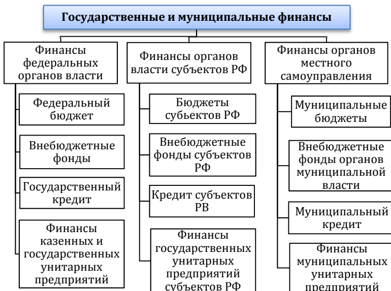
Рис. 1.2. Государственные и муниципальные финансы

В Российской Федерации государственные финансы включают в себя два уровня: финансы федеральных органов власти и финансы органов субъектов РФ. Муниципальные финансы — обособлены в самостоятельный структурный уровень — финансы органов местного самоуправления (рис. 1.2.).