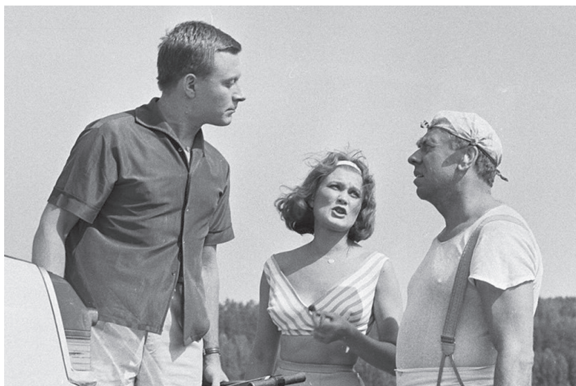
Кадр из фильма «Берегись автомобиля»

Названные выше фильмы были достаточно удачны и пользовались успехом у зрителей. Но по-настоящему судьбоносный взлет ждал режиссера впереди. Им стала культовая картина «Берегись автомобиля».