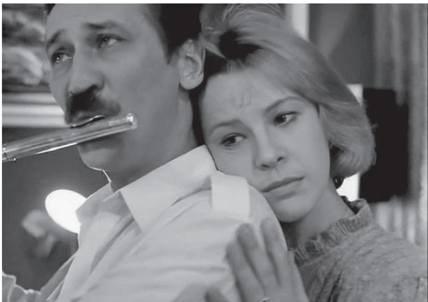
Кадр из фильма «Забытая мелодия для флейты»

Тот день прославленный режиссер называл едва ли не лучшим в своей творческой биографии. Еще бы! «Зал наэлектризован. Фильм смотрели бурно, возбужденно, — вспоминал мастер. — Зрительские реакции выражались криками, смехом, аплодисментами». Год спустя на международном кинофестивале в Мадриде «Небеса обетованные» получили Гран-при за... «лучший фантастический фильм». Эльдар Александрович с горечью говорил об этом казусе: «Картина... рассказывающая о наших бедах, о тяжелой жизни, о нищих, об обиженных системой людях, была воспринята на Западе как элегантная фантазия русского режиссера».