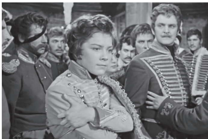
Кадр из фильма «Гусарская баллада»

Даже если бы режиссер снял одну лишь эту картину, он несомненно вошел бы в число классиков советской кинокомедии. К счастью, за фильмом «Берегись автомобиля» последовали другие рязановские шедевры, расширившие горизонты комедийного жанра отечественного киноискусства, показавшие возможности умной народной комедии. А то что Рязанов создавал именно народные комедии, близкие и понятные всем и каждому, очевидно. Он утверждал, что для него «всегда на первом месте — реальность» , и придерживался откровенного демократизма в своем творчестве. Как бывший документалист Рязанов стремился к максимальной достоверности в каждом кадре. Он исповедовал принципы так называемого «актерского кинематографа», отдавая исполнителю на экране безусловный приоритет перед камерой, цветом, светом. Ему были чужды «красивость», зализанность, граничащая с легковесностью. При этом он считал, что комедия должна быть «без зауми, с легкой поступью» .