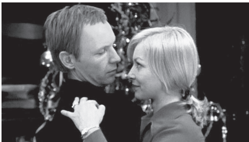
Кадр из фильма «Ирония судьбы, или С легким паром!»

Еще в 60-е годы вокруг Эльдара Рязанова стала складываться команда единомышленников. Помимо драматурга Э. Брагинского, в нее вошли композитор А. Петров, операторы В. Алисов и В. Нахабцев, художник А. Борисов. Ну и, конечно, любимые рязановские актеры: Л. Гурченко, А. Фрейндлих, С. Немоляева, В. Талызина, О. Басилашвили, А. Миронов, А. Папанов, А. Мягков и др.