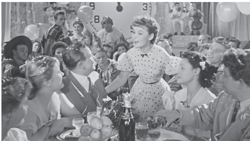
Кадр из фильма «Карнавальная ночь»

Работа над картиной шла трудно, порой «на ощупь». Еще бы! Такой смелой и раскованной новогодней феерии у нас в стране еще никто никогда не снимал. Отпущенные деньги заканчивались, сроки поджимали, производство и группа буквально испытывали режиссера на прочность. На худсовете Рязанов показал черновую сборку примерно половины фильма. «Среди членов художественного совета, — пишет он, — не обнаружилось никого, кто в своей жизни поставил бы хотя бы одну комедию». Мнение собравшихся было единодушным: «материал сочли серым, скучным и бездарным» (!).