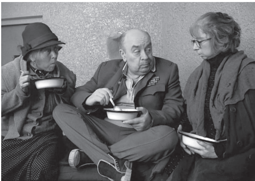
Кадр из фильма «Небеса обетованные»

В эти трудные для страны годы Эльдар Рязанов возобновляет работу на теперь уже независимом ТВ (в 80-е он вел в «Останкино» «Кинопа-нораму»), возвращает популярнейшую телепередачу, снимает увлекательные телеинтервью с со «звездами», авторские программы. А еще издает свои пьесы, стихи, художественную прозу... Но без режиссерского творчества для него жизни нет. И он не покидает съемочной площадки, тем более что спонсоры охотно вкладывают средства в рязановские картины.