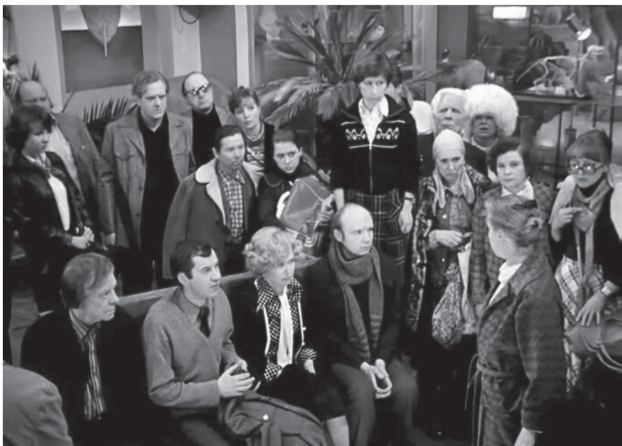
Кадр из фильма «Гараж»