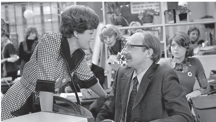
Кадр из фильма «Служебный роман»