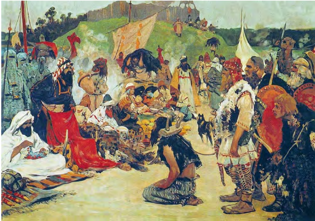
Рис. 2. Торг в стране восточных славян (худ. С.В. Иванов, 1909 г.)