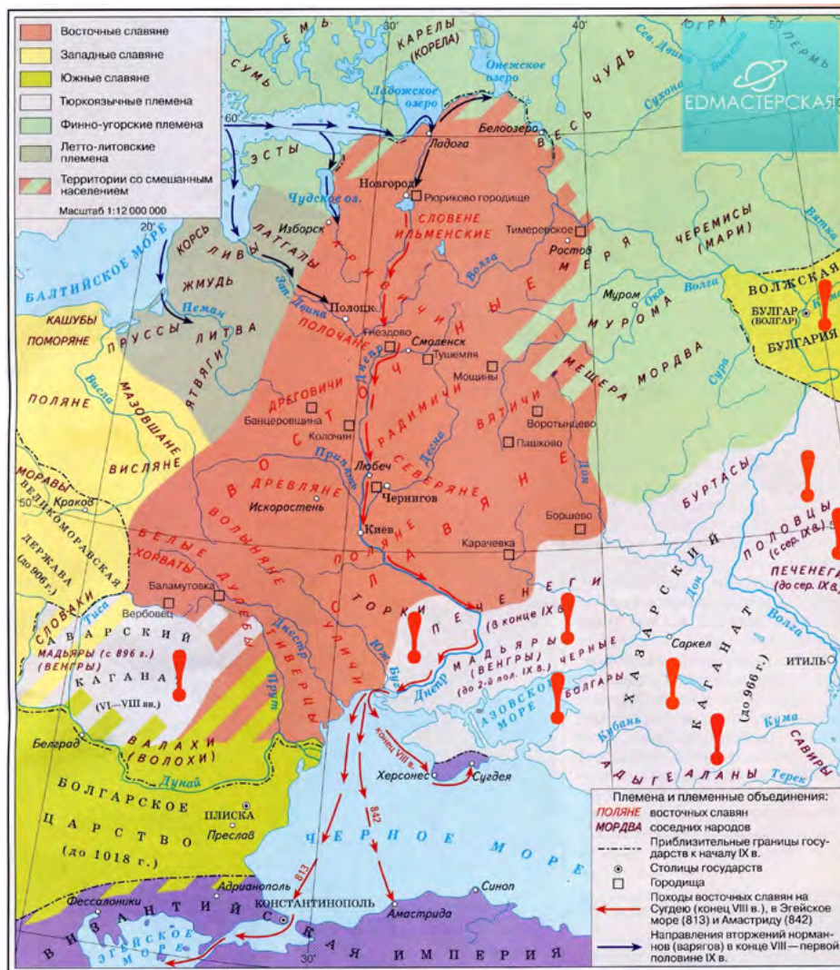
Рис. 1. Восточные славяне и их соседи в VI–IX вв.

4. Внимательно изучите историческую карту и ответьте на вопросы.