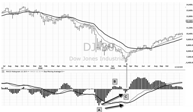
Рис. 1. Недельный график индекса DJIA, бычье расхождение

нулевую линию снизу вверх, “ломая хребет медведю”. Когда цены падают до нового минимума, гистограмма MACD идет вниз, пересекая нулевую линию, и формирует более мелкое дно. В этом месте цены находятся ниже, а дно гистограммы MACD оказывается более высоким, указывая на то, что медведи слабеют, и нисходящий тренд готов к развороту. Подъем гистограммы MACD от второго дна дает сигнал покупки».