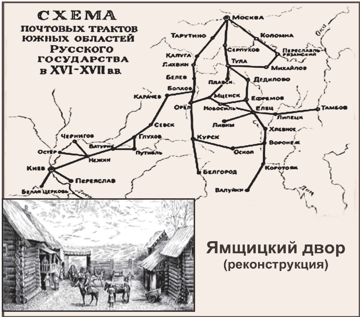
Ямщицкий двор (реконструкция)