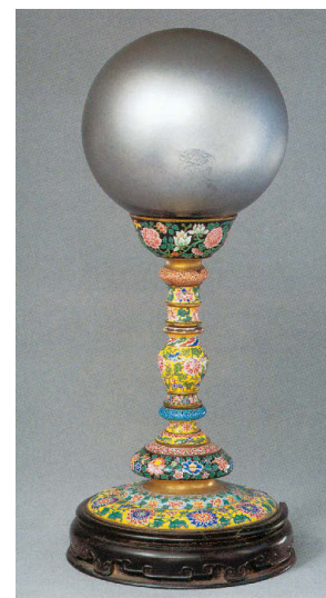
Подставка для стеклянной небесной сферы с орнаментом «цветы и бабочки» / Расписная эмаль