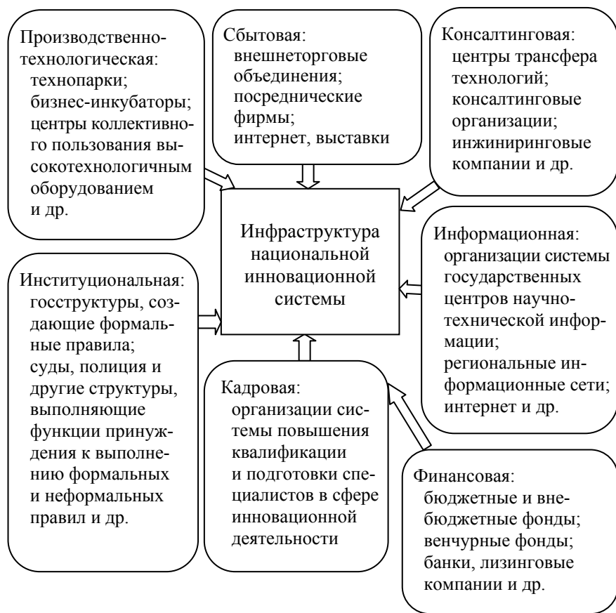
Рис. 1.2. Компоненты инновационной инфраструктуры

тавляют правовую защиту создаваемых инноваций, оказывают помощь в бухгалтерском учете, по экономическим и другим вопросам. Для того чтобы получить услуги бизнес-инкубаторов и необходимые производственные помещения, оборудование и т.п., необходимо разработать перспективный и реальный для воплощения бизнес-план [56].