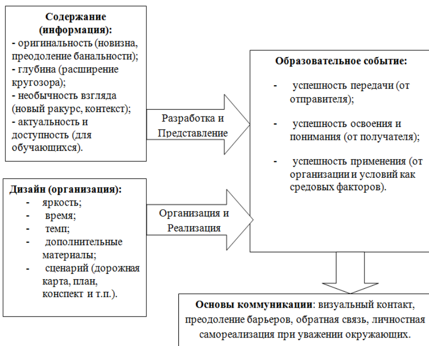
Схема 1. Событийный подход в образовании

Схема 1 показывает значимые акценты событийного подхода. Стремиться сделать проводимые занятия образовательными событиями определяет успешность педагога, не только готового использовать имеющиеся лучшие практики, но и продуцировать оригинальные идеи.