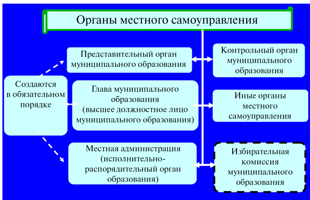
Рис. 5. Организационная структура муниципального образования

Контрольно-счетный орган муниципального образования образуется в целях осуществления внешнего муниципального финансового контроля за исполнением местного бюджета, соблюдением установленного порядка подготовки и рассмотрения проекта местного бюджета, отчета о его исполнении, а также в целях контроля за соблюдением установленного порядка управления и распоряжения имуществом, находящимся в муниципальной собственности.