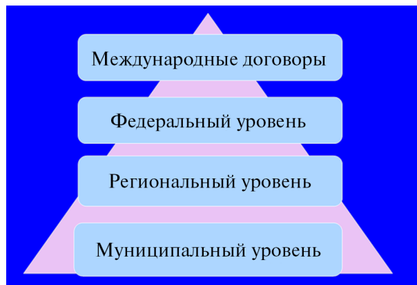
Рис. 1. Правовая основа местного самоуправления