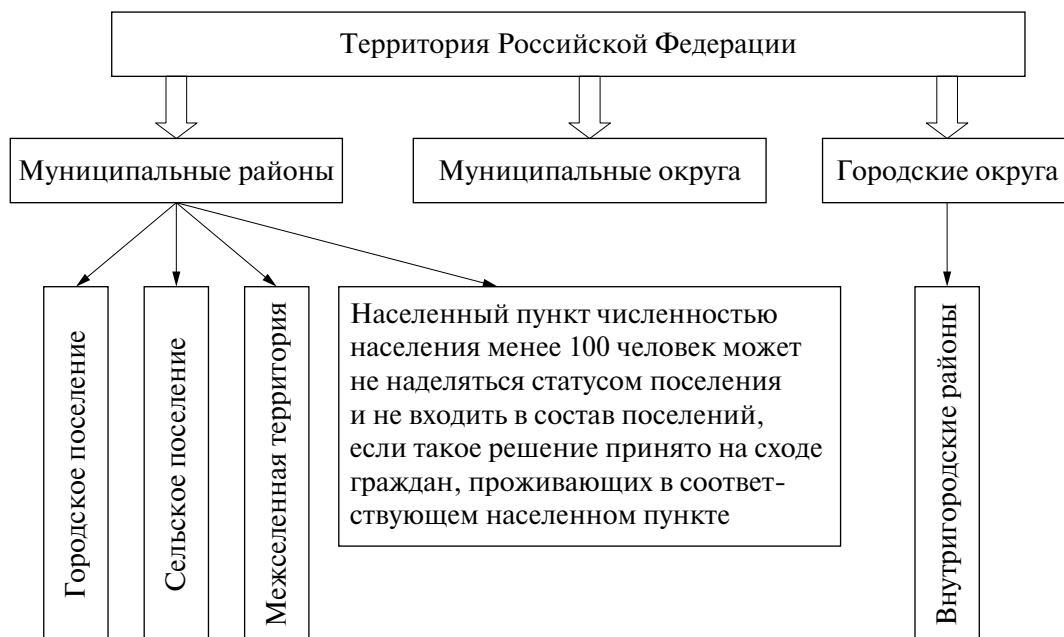
Рис. 2. Модель территориальной организации муниципальных образований

селенных пунктов). Помимо земель населенных пунктов в состав муниципальных образований могут входить также прилегающие к ним земли общего пользования, территории традиционного природопользования населения, земли рекреационного назначения, земли для развития муниципального образования.